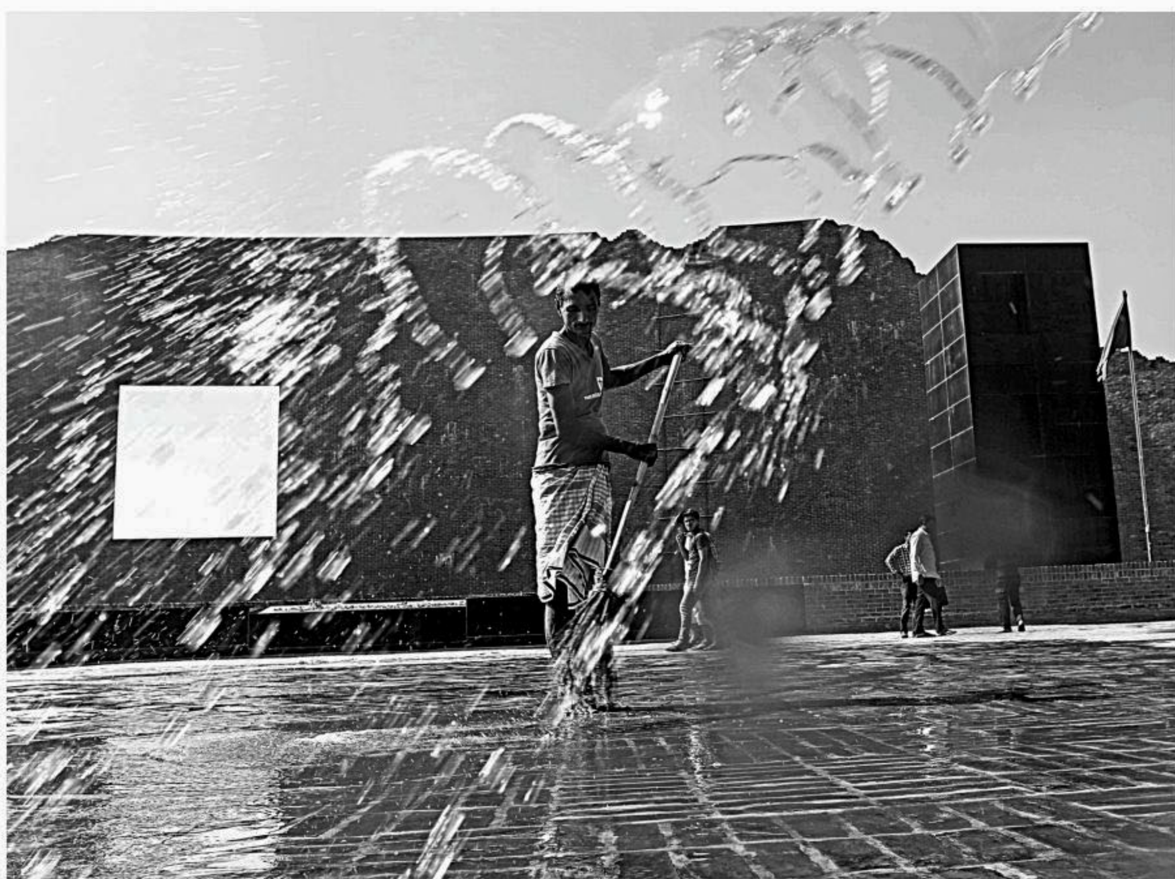
Workers busy cleaning the premises of Martyred Intellectuals' Memorial at the capital's Rayerbazar yesterday ahead of Victory Day.

Team Pratishwik defeated the first, second and third runners-up Buet ORCS, NSU Crispr, and IUT Stark respectively.