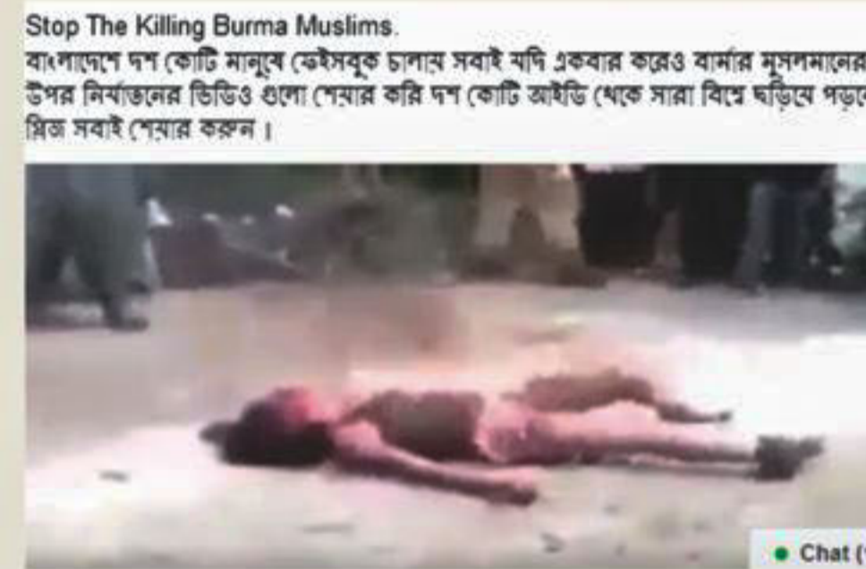
An image of a girl burned to death by a mob in Guatemala in May 2015. But accompanying text reads "Stop Killing Burma Muslims".