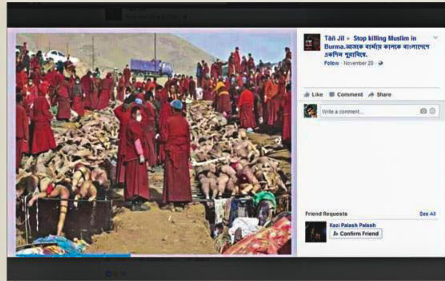
A page calling for an end to the "killing of Muslims in Myanmar" posts a photo of monks preparing for the cremation of quake victims in China.