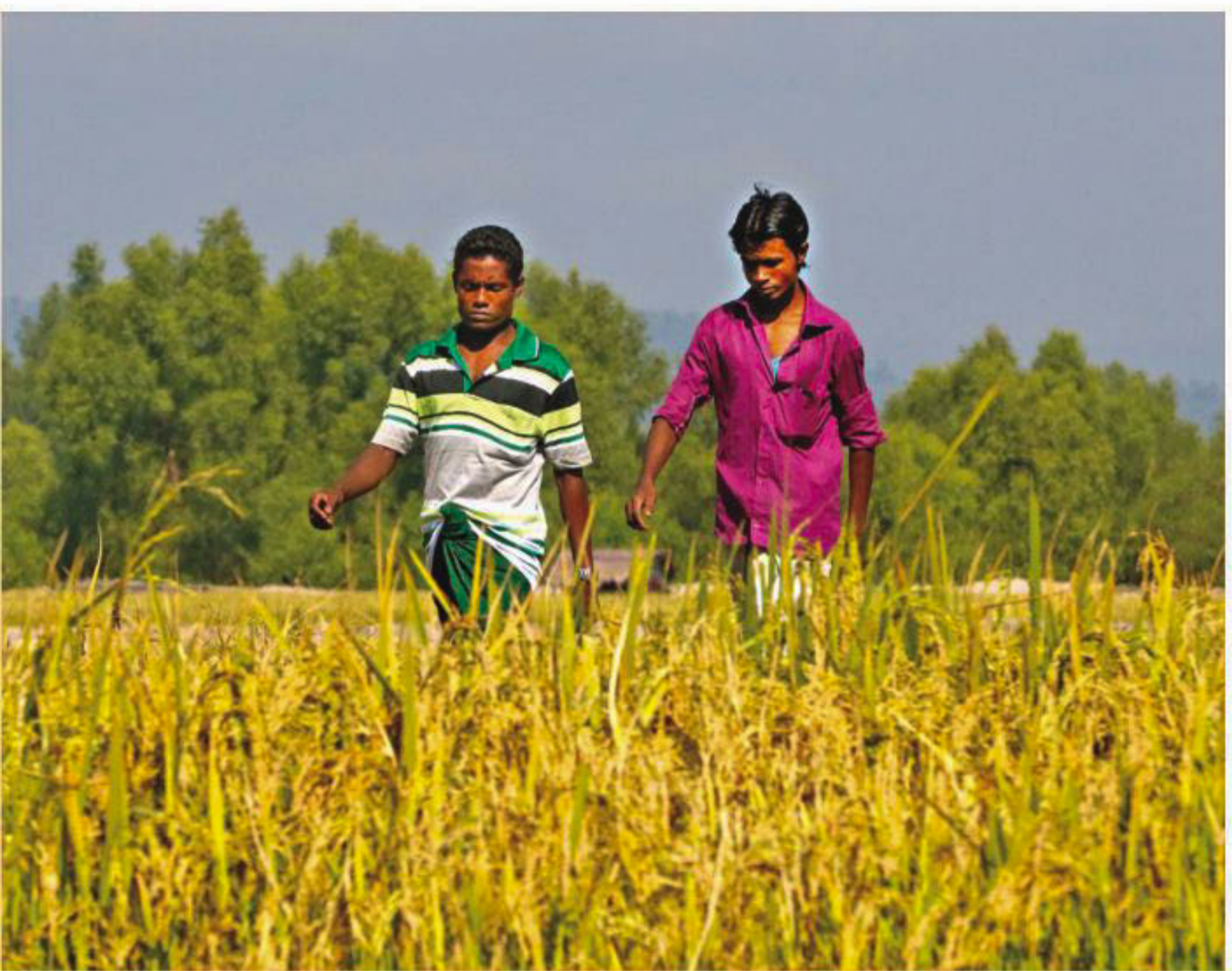
Two Rohingyas walking through a paddy field near Techchi bridge point in Teknaf, Cox's Bazar, around 1:00pm yesterday shortly after they entered Bangladesh from Myanmar. Like them, many Rohingyas are crossing into Bangladesh every day with the help of brokers in both the countries.