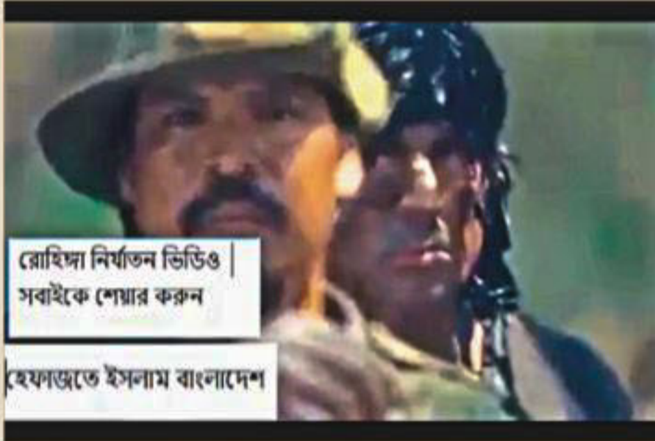
A frame from a Rambo film with texts in Bangla -- "video of torture on Rohingyas: share it with everyone" and "Hefajat-e Islam".