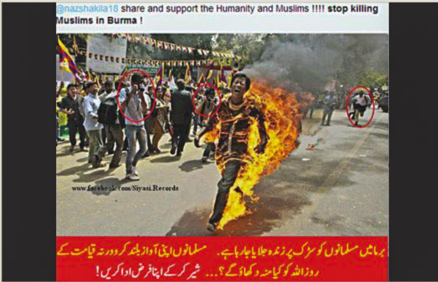
Suggesting that it is a scene of Rohingya persecution, a page posts the photo of self-immolation of a Tibetan activist in New Delhi.

THESE ARE NOT IMAGES OF ATROCITIES AGAINST ROHINGYAS