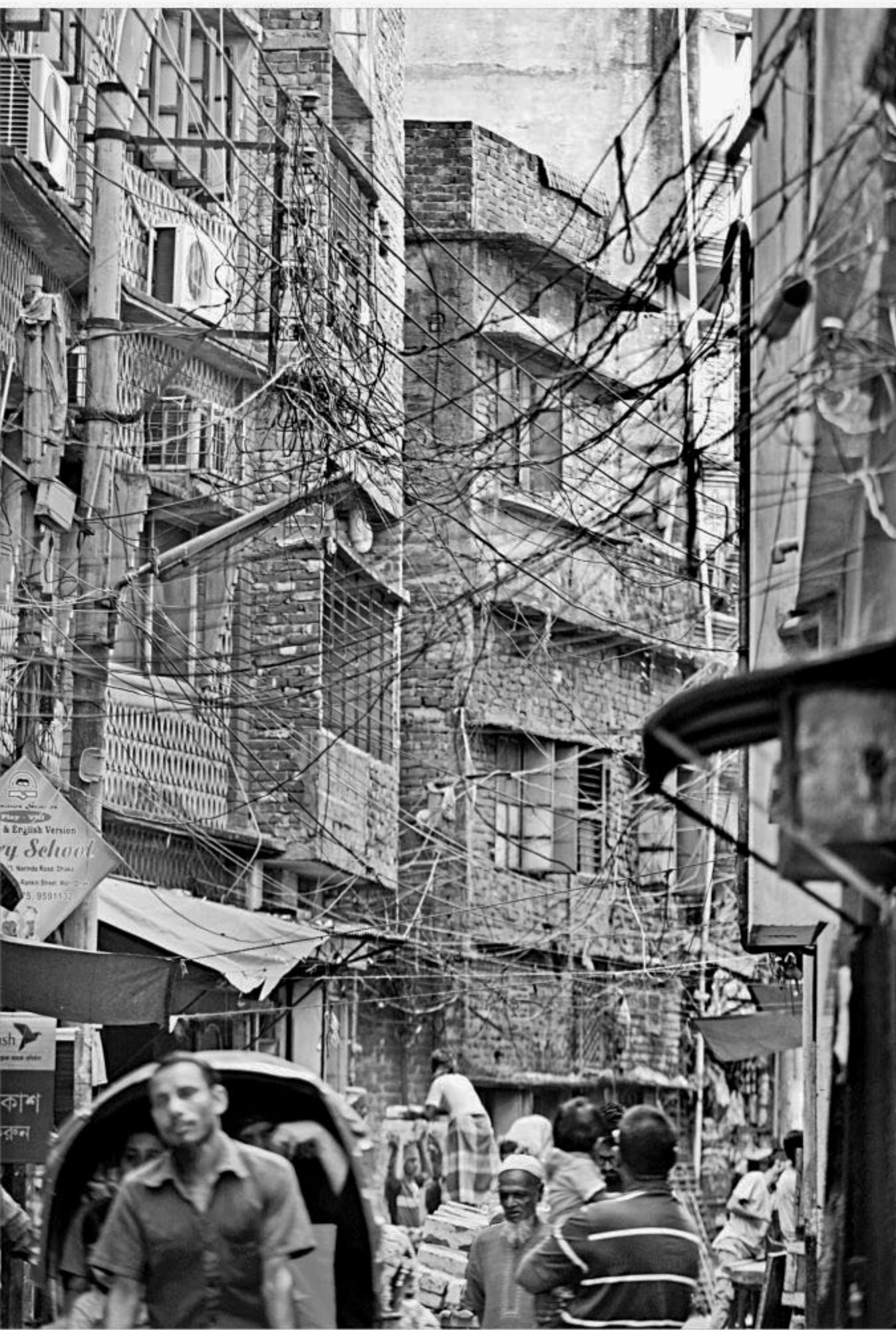
Tangles of overhead wires dangling between the utility poles on a street posing risk to the residents in South Maishundi area of the capital's Narinda. The photo was taken yesterday.