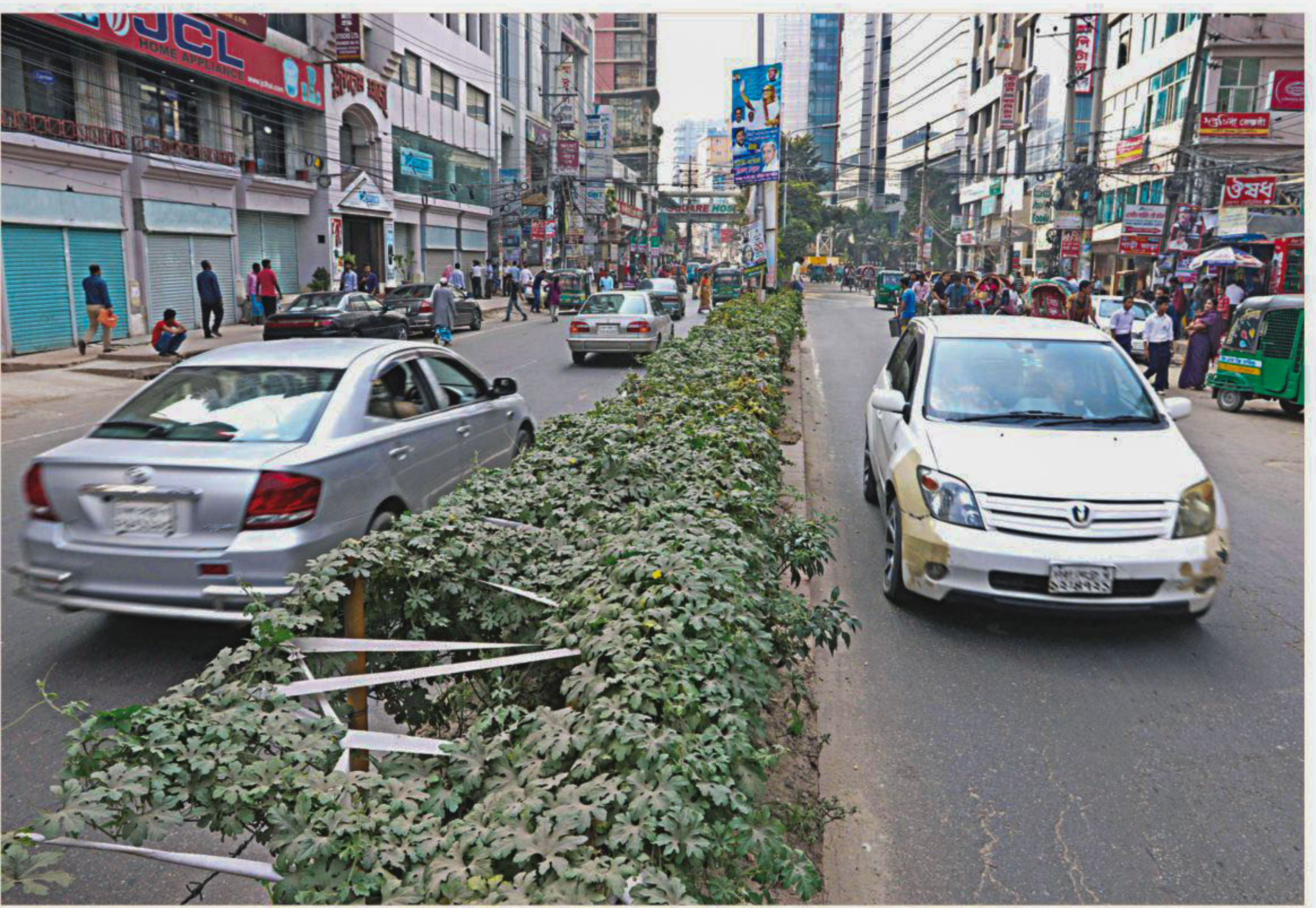
Bitter melon being cultivated on a section of the median strip at Russel Square by individuals who are yet to be identified. Though found in most roads in the capital, central reservations are usually kept unused. The photo was taken on Sunday.