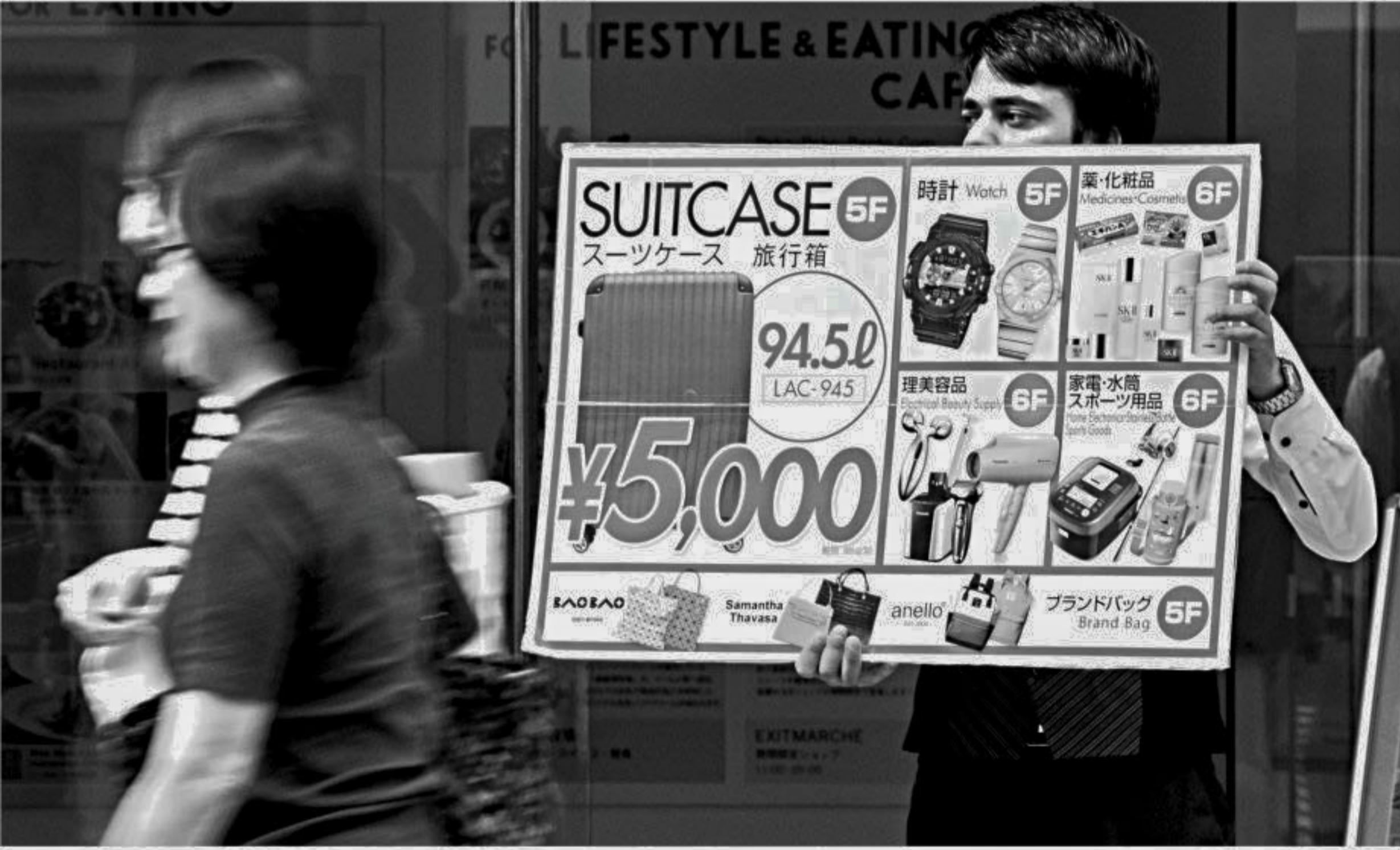
Women walk past a sales clerk holding a signboard in front of his shop in Tokyo on Friday.

Friday's data come ahead of the BoJ's closely watched Tankan quarterly business sentiment survey, due Monday. Economists expect the headline confidence index among large manufacturers to tick up in the October report, according to a Bloomberg survey.