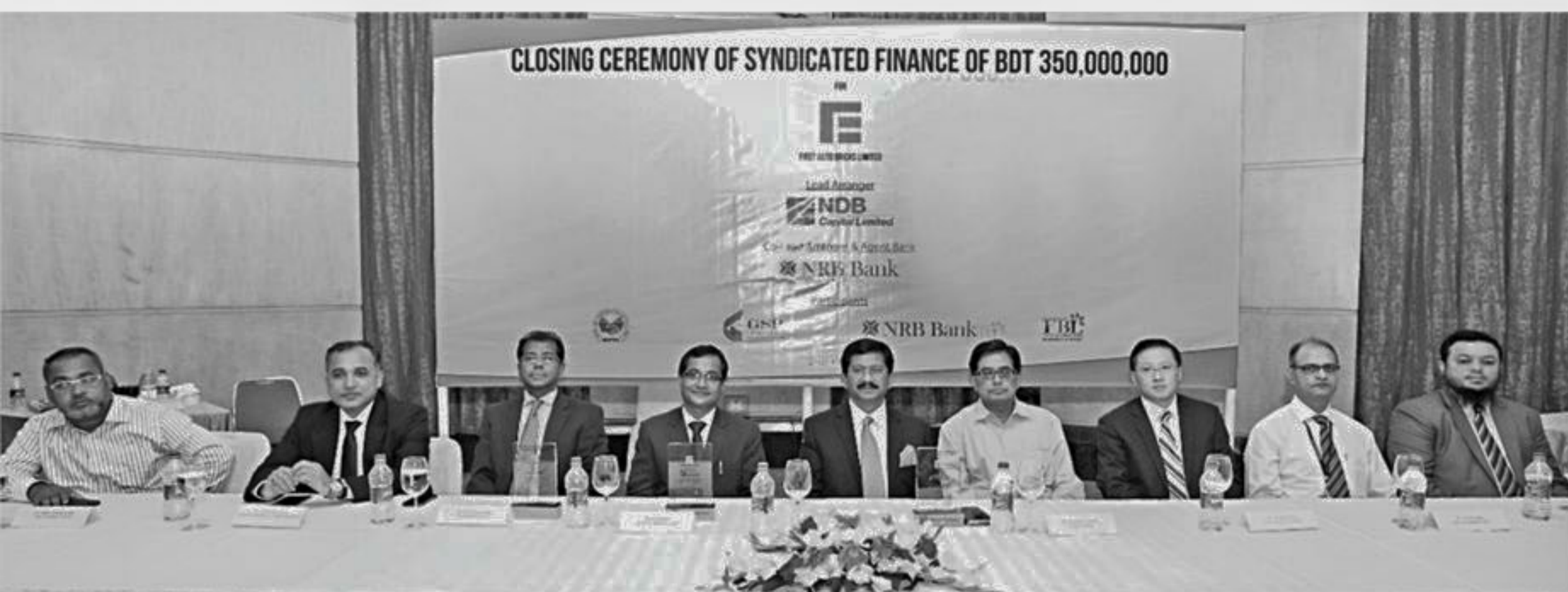
The closing ceremony of a syndicated loan of Tk 35 crore for First Autobricks Ltd was held at The Westin in Dhaka on September 27. NDB Capital was the lead arranger while NRB Bank was the co-lead arranger for the loan under the green financing initiative of Bangladesh Bank with the sustainable development fund of Asian Development Bank. The participants of the syndication include NRB Bank, The Farmers Bank, Bangladesh Infrastructure Finance Fund Ltd and GSP Finance Company (Bd) Ltd.