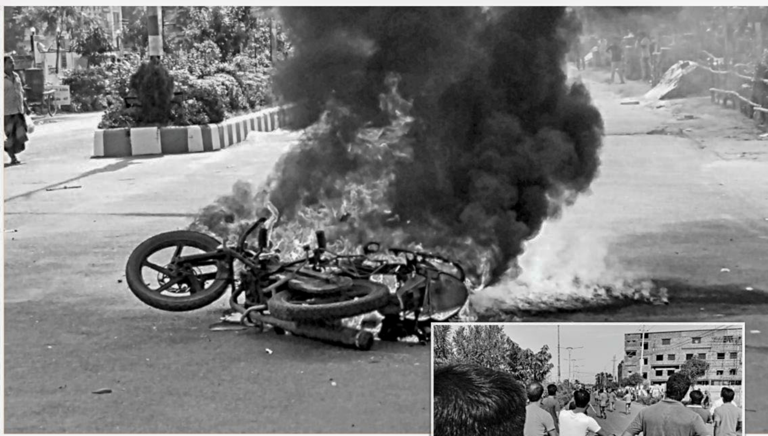
A motorcycle burns after being set alight by the unruly BCL men in front of the Government Azizul Haque College after a fellow activist was killed in an attack by local Jubo League men over a trivial matter. Inset, agitating BCL men take to the street at Satmatha intersection in Bogra town.