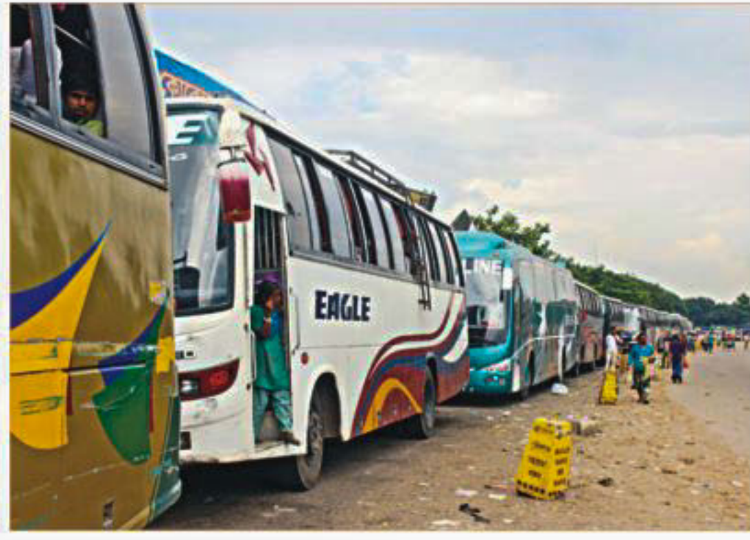
With no room inside the carriages, a man tries to get a small child on the roof of Meghna Express heading for Chandpur from Chittagong Railway Station yesterday. A long queue of buses, left, at the Paturia Ferry Terminal waiting to cross the Padma and people, right, at a bus counter in Gabtoli wait for their buses that were delayed for hours yesterday.