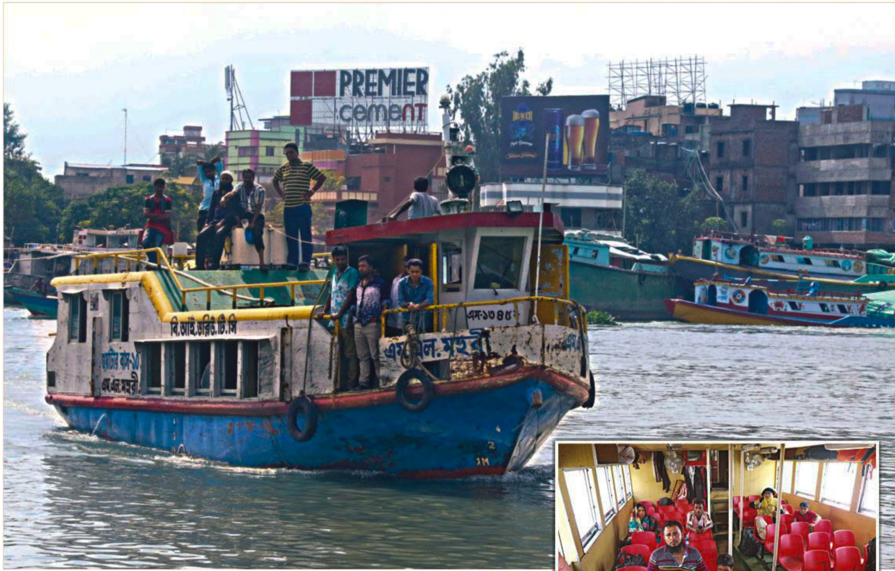
One of the waterbuses, now in operation on Gabtoli-Sadarghat route, plies the Turag river at Aminbazar point. Inset, most of the seats are empty as the service has failed to attract passengers. The photos were taken earlier this month.

STAFF CORRESPONDENT The 40th death anniversary of National Poet Kazi Nazrul Islam will be observed today. Nazrul, who enriched Bangla literature with his genius, breathed his last in Dhaka on 12th Bhadro of Bangla calendar year 1383 (August 29, 1976) at the age of 77. He was buried with full state honours beside the Dhaka University Central Mosque. SEE PAGE 11 COL 2