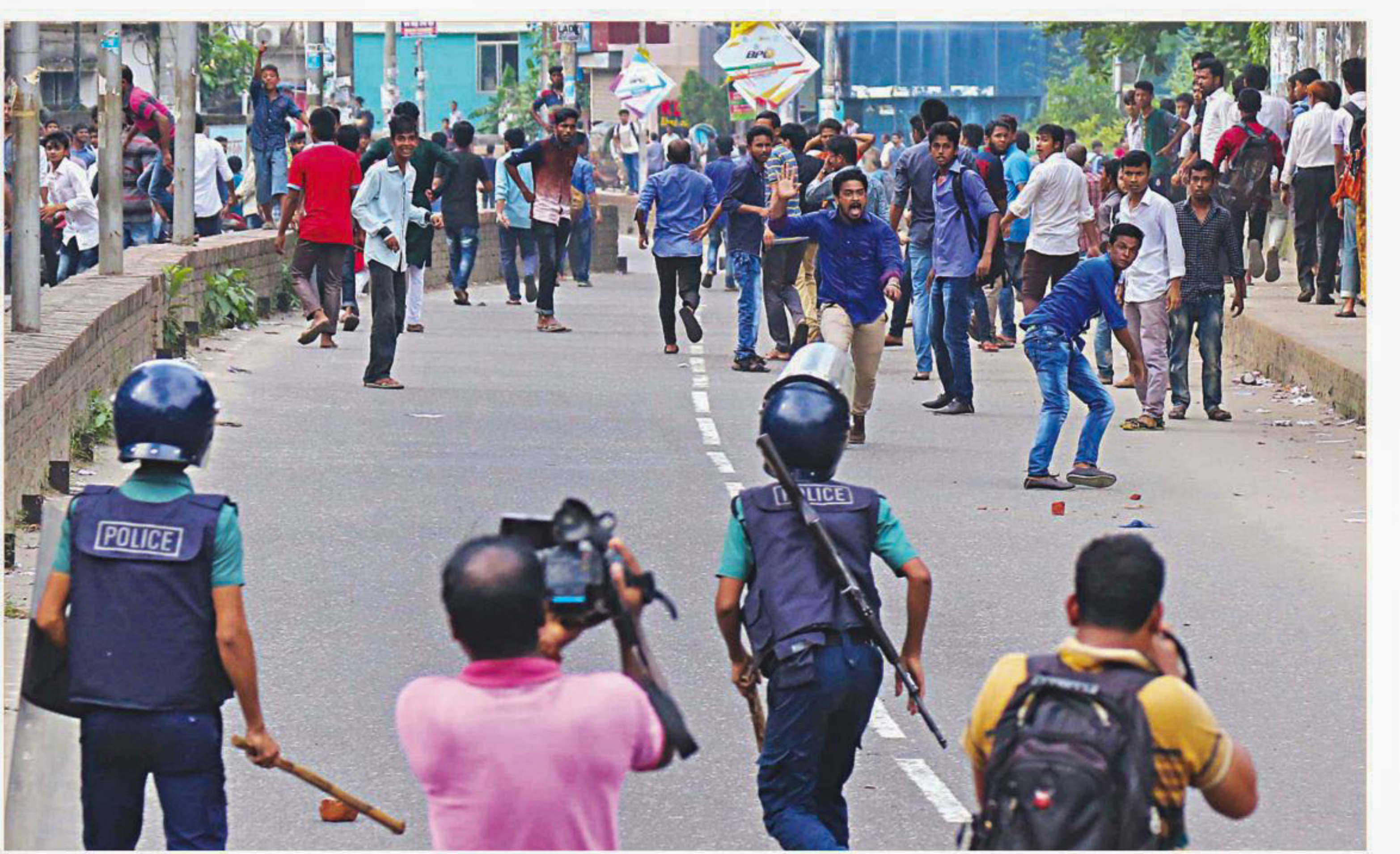
Police disperse Bangladesh Chhatra League men who blocked the road in front of Chittagong College in the port city yesterday following the shooting of three activists of the student organisation during a scuffle between two factions.

A Rajdhani Umnayan Kartripakkha mobile court demolished three restaurants and six under-construction shops and a mess of an institution in the capital's Dhanmondi yesterday. The court led by executive magistrate Nasir Uddin also cut off the utility lines of the businesses. It asked owners of a restaurant, a coaching centre and a dental clinic to remove their establishments on their own. Another mobile court demolished a kitchen market, which was being run on the basement of a building, and fined two Chinese restaurants Tk 1.7 lakh for running their business illegally in Banasree. The court of executive magistrate Khandokar Zakir Hossain also removed 15 ramps from in front of 15 buildings, which were constructed on footpaths in the area.