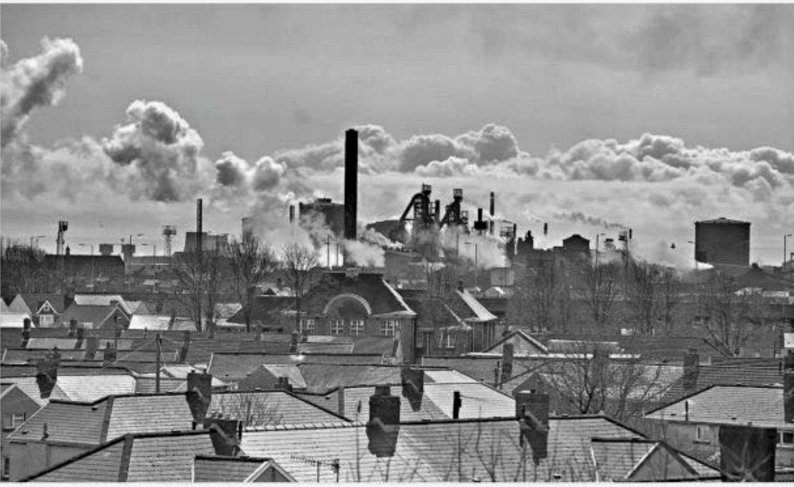
Wales has been hit hard by the decline in Britain's steel industry.