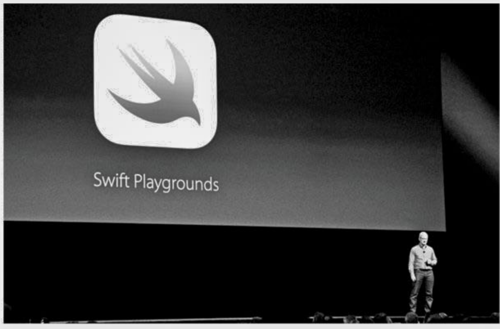
Apple CEO Tim Cook delivers the keynote address at Apple's annual Worldwide Developers Conference in San Francisco, California on Monday.

That was followed up by a demonstration of a new operating system for the Apple Watch that opens apps