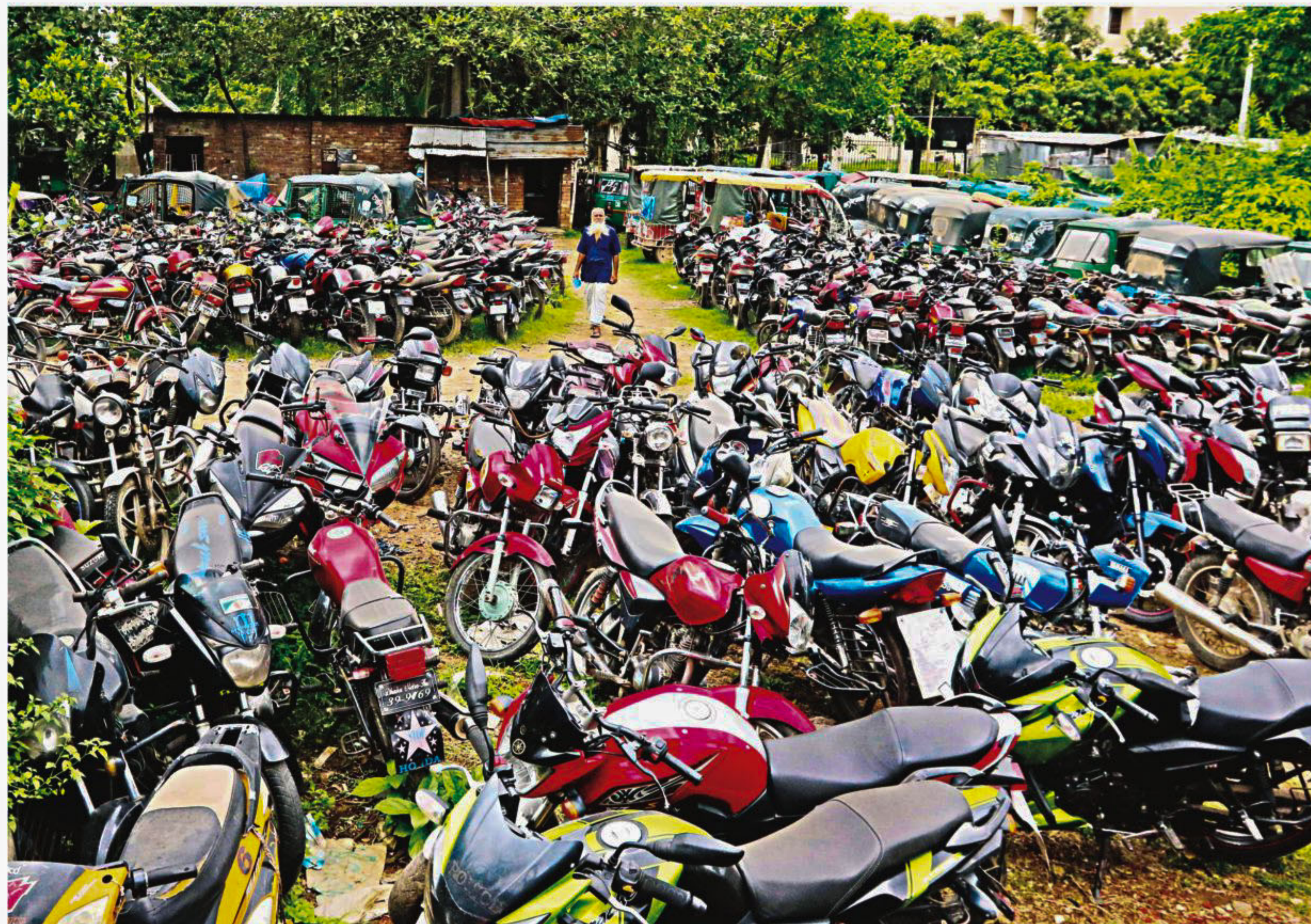
Hundreds of motorcycles and CNG-run auto-rickshaws, seized by law enforcers for not having legal documents, are left under the open sky in an enclosure close to the Sher-e-Bangla Nagar Police Station in the capital's Agargaon area. Many of these vehicles not only rust away but also become unusable.