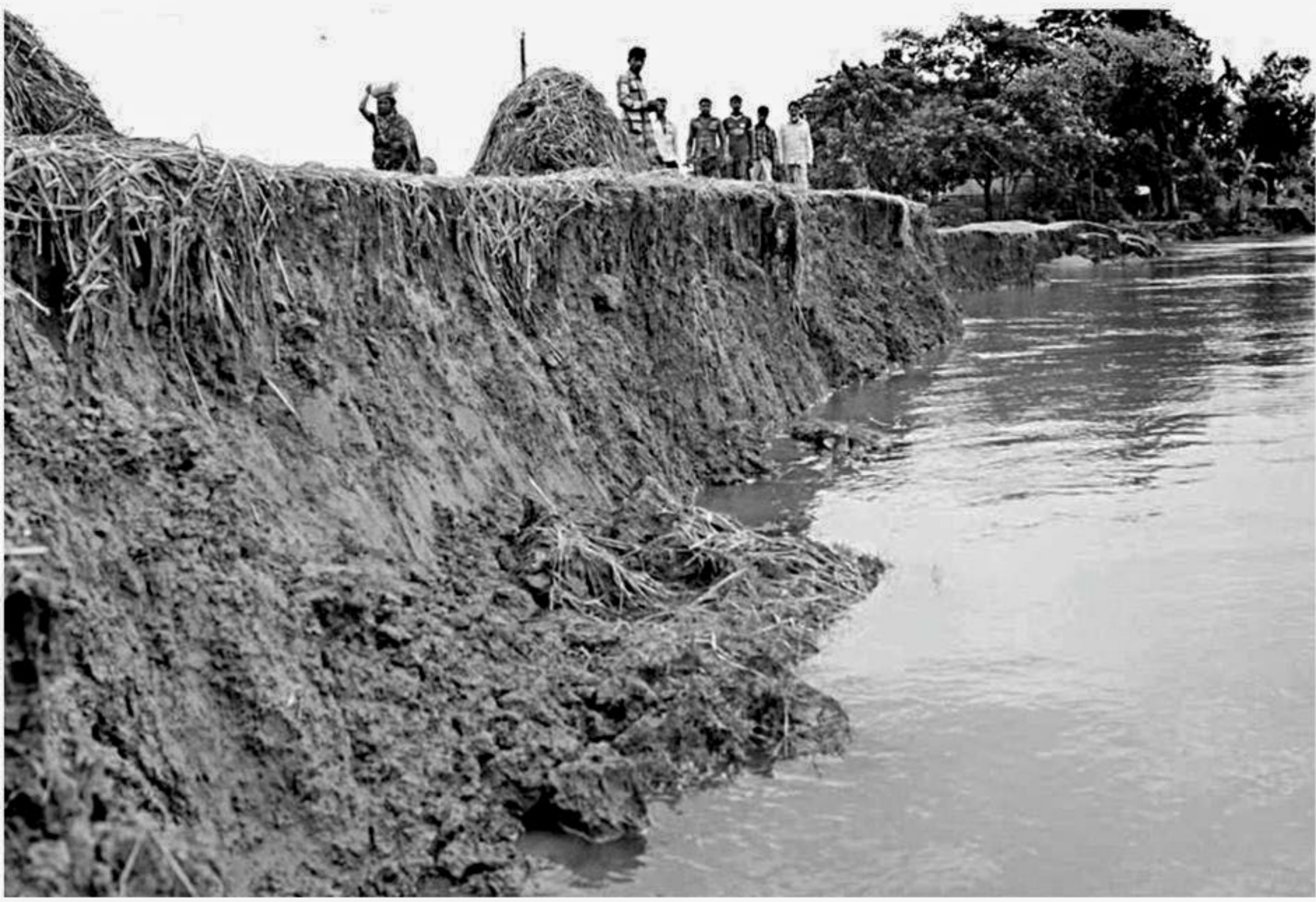
Flash flood triggered by heavy downpour causes serious erosion to the embankment on the Chengerkhal River that has devoured 60 houses at Shimulkandi village in Khadimnagar union of Sylhet Sadar upazila and put more areas under threat. The photo was taken yesterday.