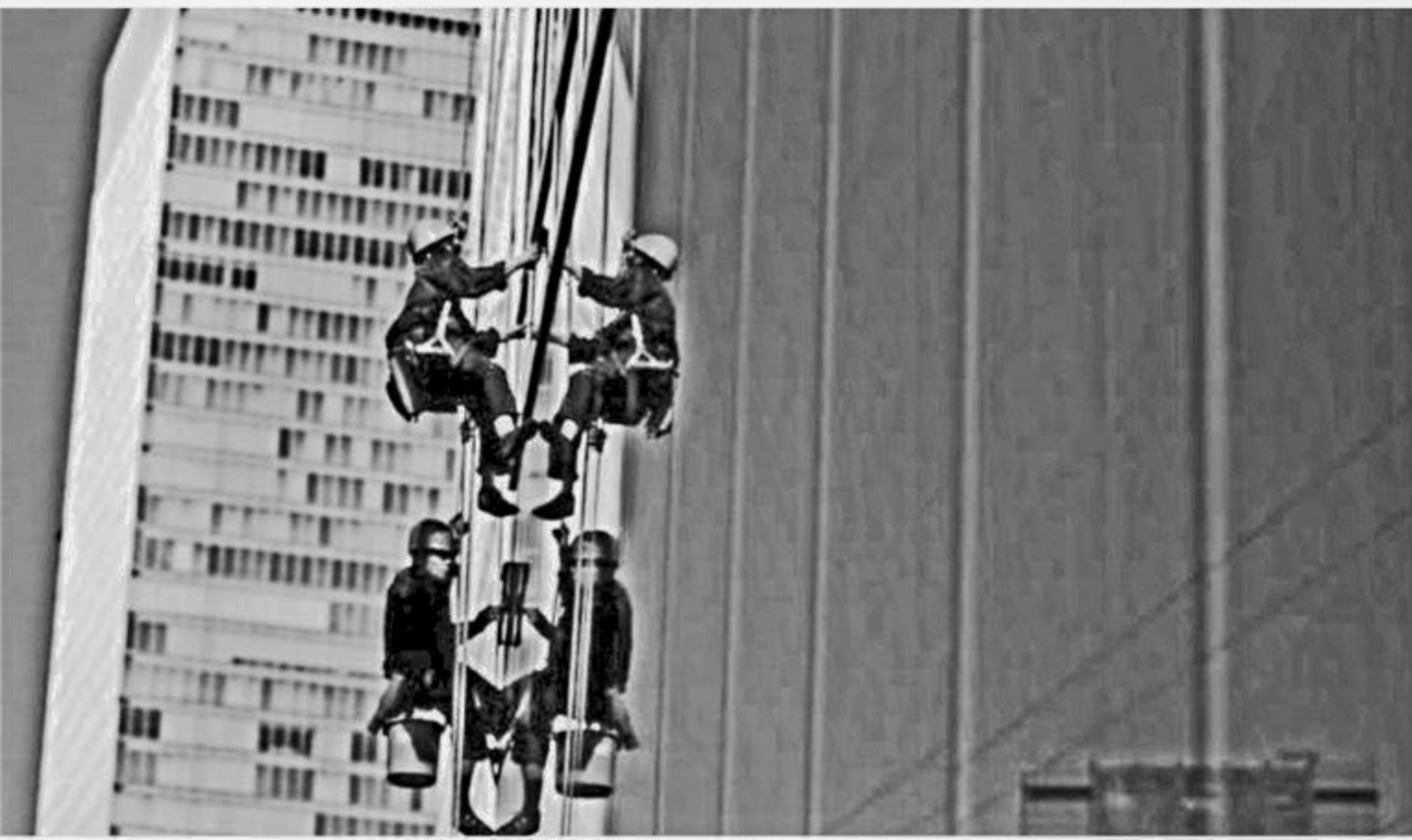
Workers clean windows at an office building in a business district in Tokyo, Japan.