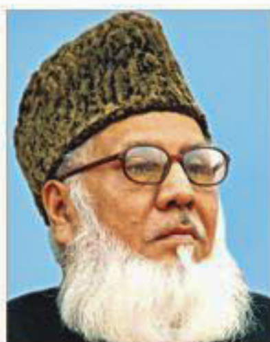
SEE PAGE 10 COL 2

The scope of reviewing the SC judgment in such a case is very limited, he