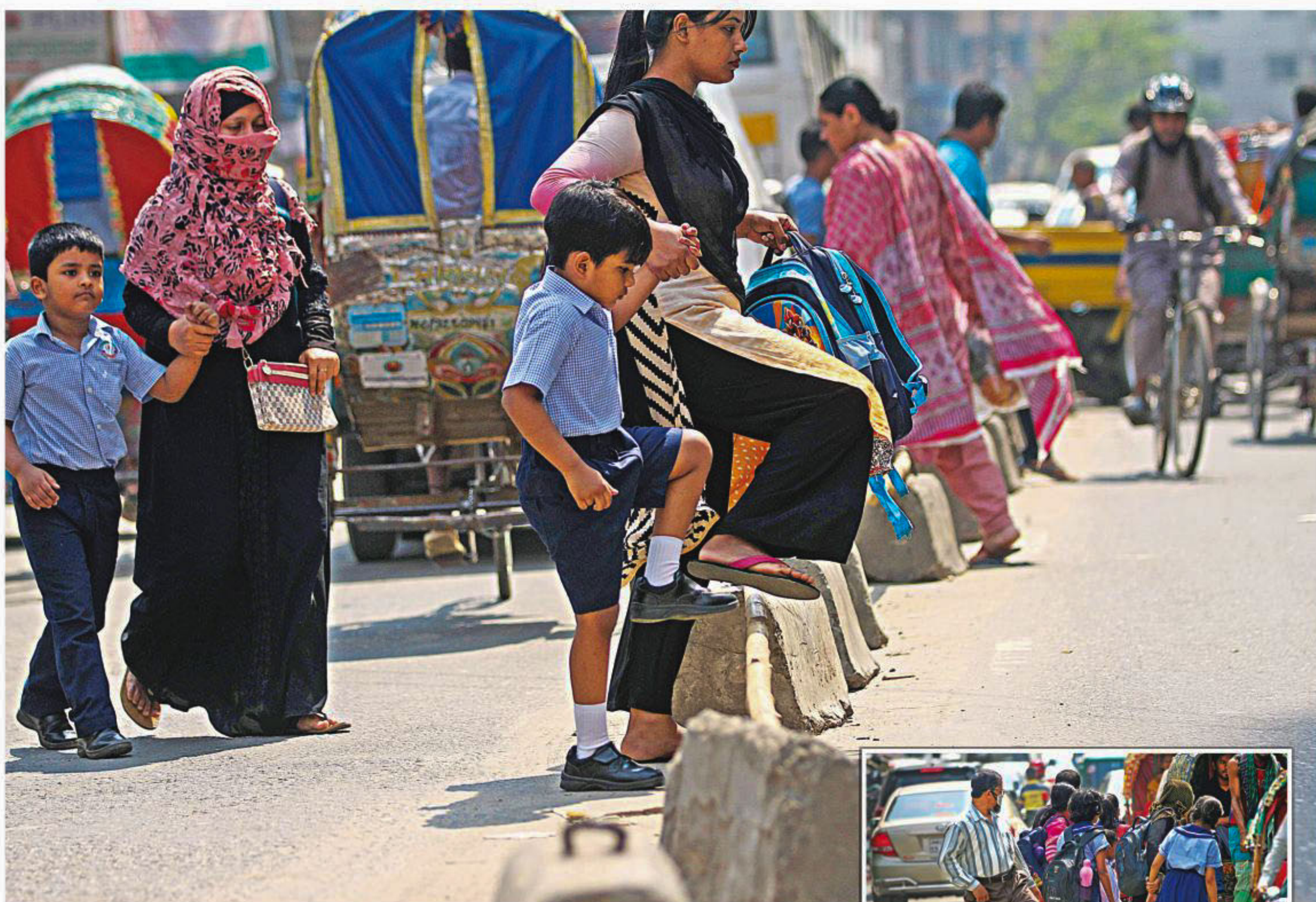
With no zebra crossing around, schoolchildren along with their guardians crossing the road near South Point School & College in the city's Malibagh Chowdhurypara, risking their lives. Inset, students stuck in the middle of the road. The photos were taken last week.