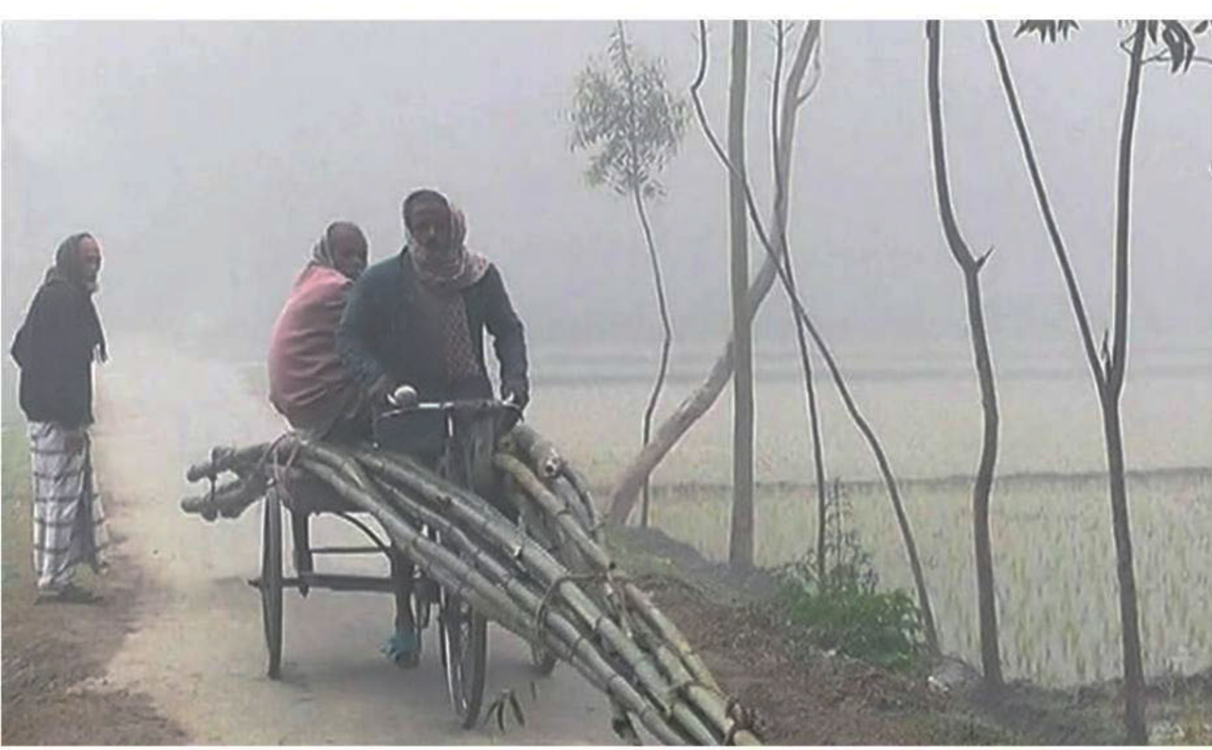
In dense fog and bitter cold, labourers go to work in Harikesh area in Kurigram Sadar yesterday morning. A sudden drop in the mercury has put many, especially the poor, in difficulty across the country. Story on page 2.