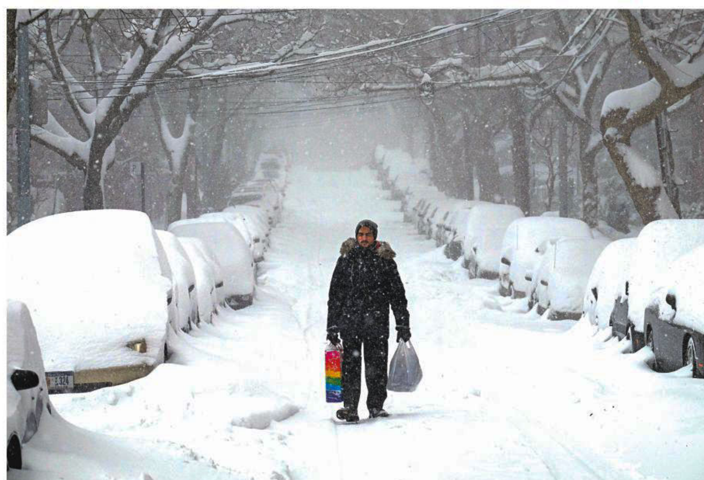
A man makes his way during a storm in New York on Saturday. A massive blizzard that claimed at least 19 lives in the eastern United States finally appeared to be winding down yesterday.