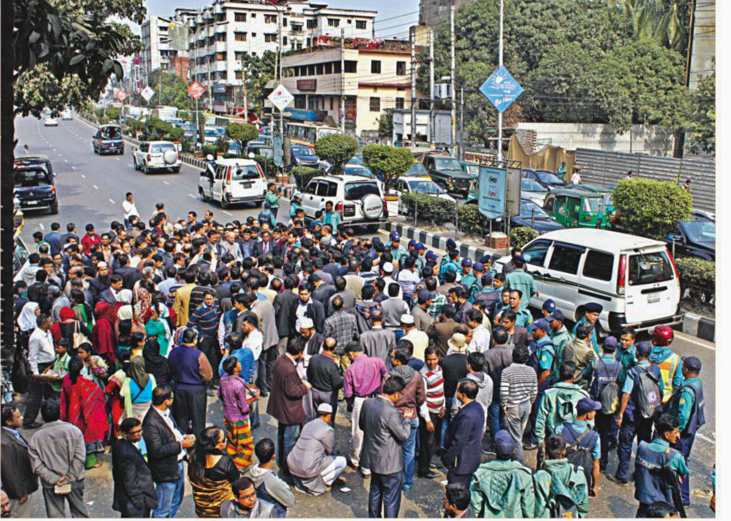
Prokrichi-BCS Samannaya Committee, an association of government officials including engineers, agriculturists and physicians, stages a sit-in in the capital's Farmgate area yesterday, demanding restoration of time scale and selection grade in the eighth payscale to remove, what they say in a statement, "discrimination" in salaries and status among officials and employees.

প্রশাসন, মানবসম্পদ উন্নয়ন ও পরিকল্পনা বিভাগ বাংলা একাডেমি, ঢাকা ১০০০ ফোন : ০২-৫৮৬১১২৩৯