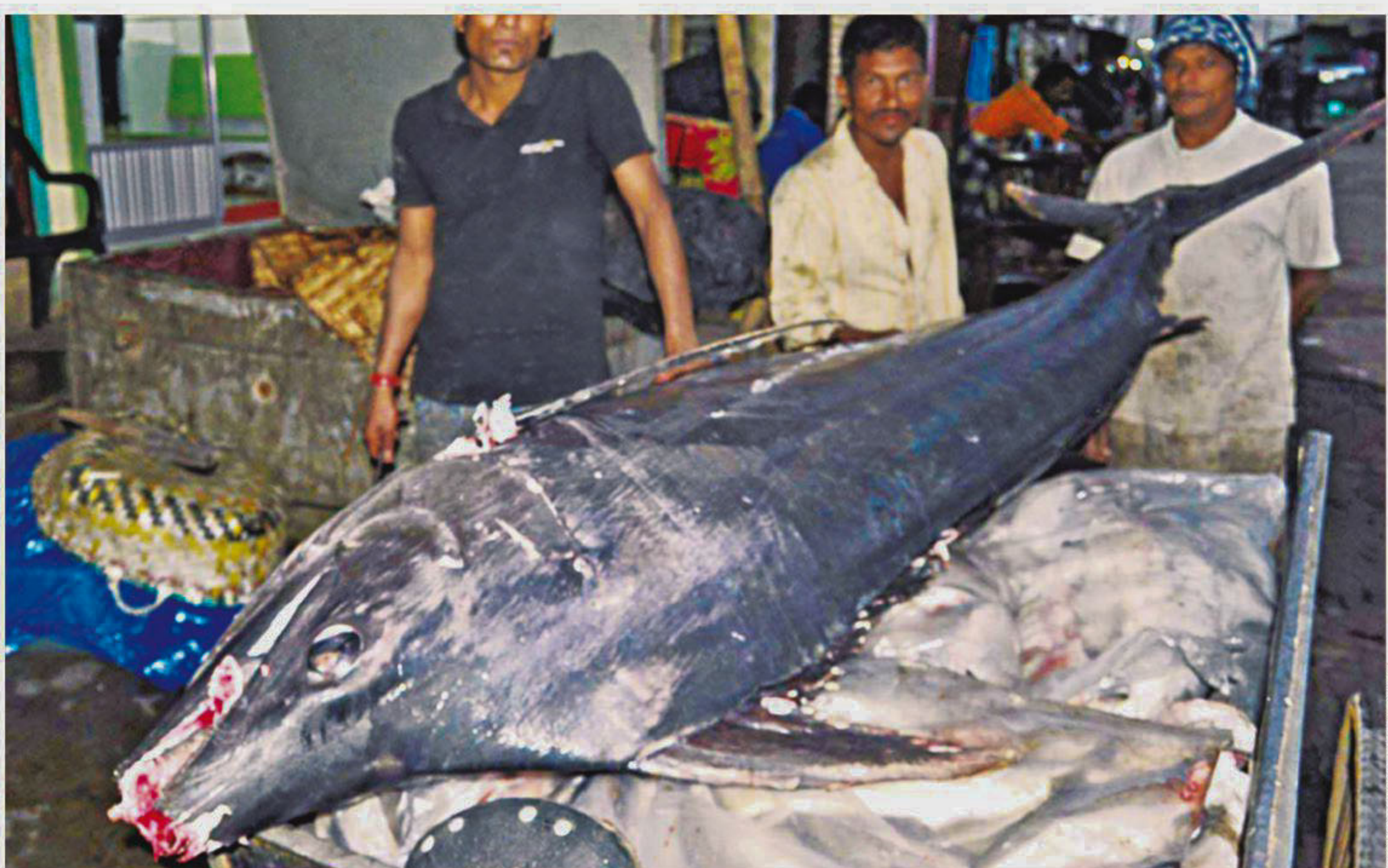
Fishermen showcase a 160kg saltwater Ayer fish at the wholesale fish market in Firingi Bazar of Chittagong yesterday.

The ACC filed the case on August 8, 2011 against Khaleda and three others accusing them of abusing power in collusion with each other for setting up a charitable trust named after former president and BNP founder Ziaur Rahman.