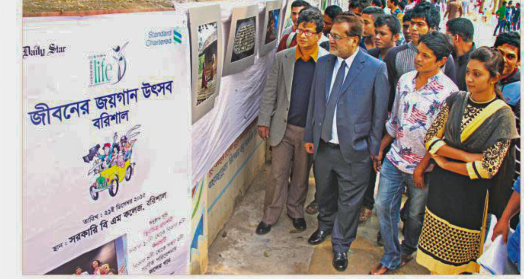
Students, teachers, and visitors at Govt BM College, Barisal look at photographs taken by past winners of The Daily Star-Standard Chartered Bank Celebrating Life competition, at an exhibition organised on the campus on Sunday as a part of this year's district level festivals.