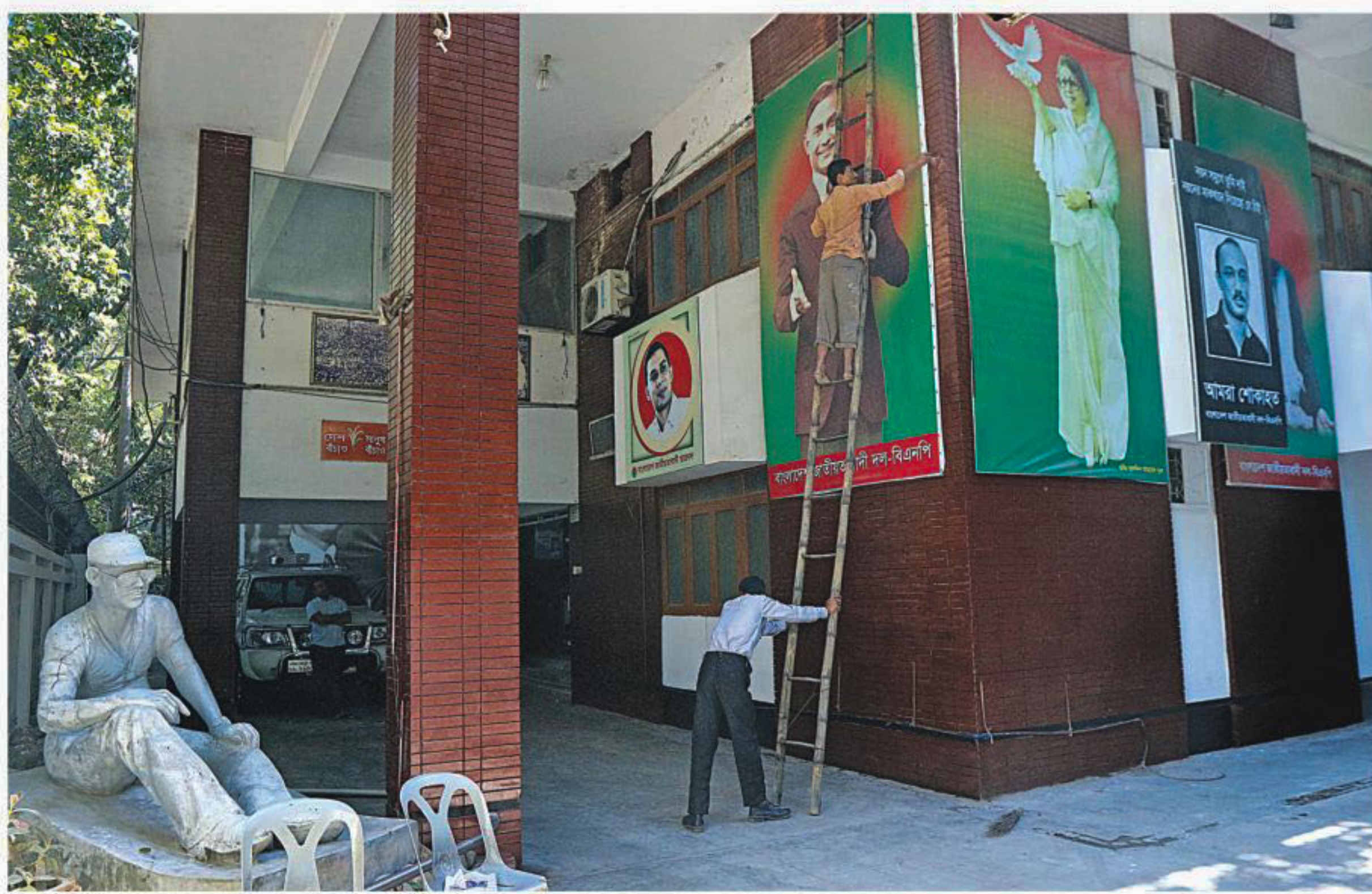
A man paints a wall of Khaleda Zia's Gulshan office in the capital on Saturday. The entire building has been cleaned. The BNP chief returned home on that day after staying in the UK for more than two months and is likely to go to the office tomorrow.