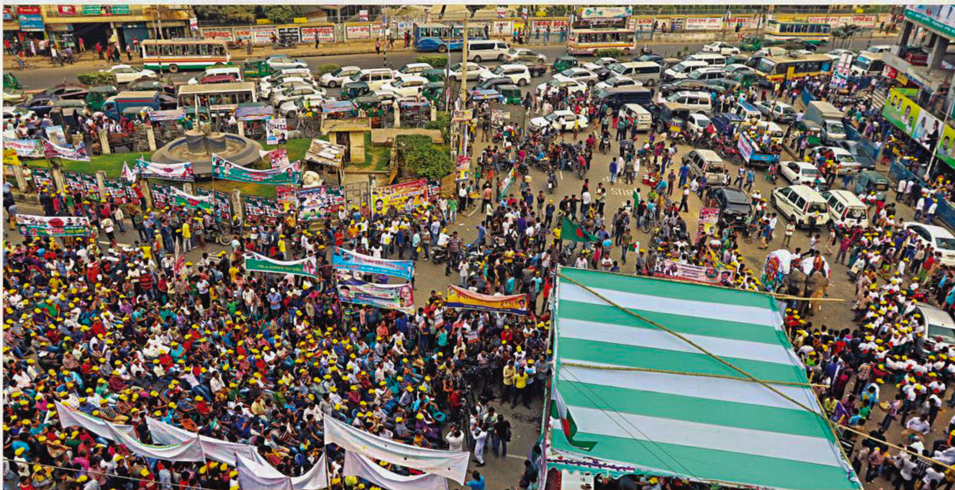
Dhaka city (north) Jubo League holds a rally at Farmgate bus stop in the capital yesterday afternoon, causing long tailbacks on Kazi Nazrul Islam Avenue and other connected streets. The programme marked the 43rd founding anniversary of Jubo League, the youth wing of ruling Awami League, which was actually on November 11.