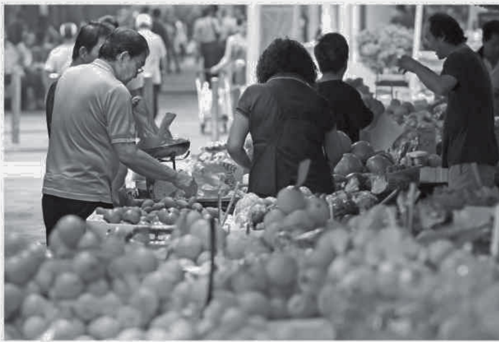
A vendor weighs fruits at a market stall in Singapore yesterday.

An economic slump in China -- the world's second biggest economy -- is hurting demand for exports from Singapore and other Asian countries.