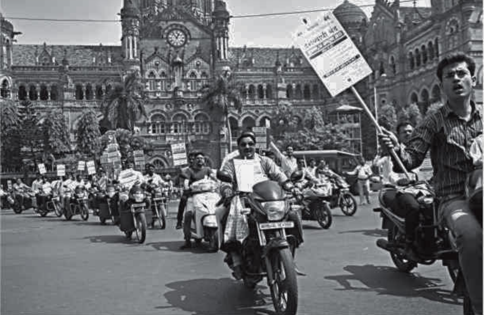
Indian pharmacy shop owners ride on bikes as they shout slogans during a protest in Mumbai yesterday.