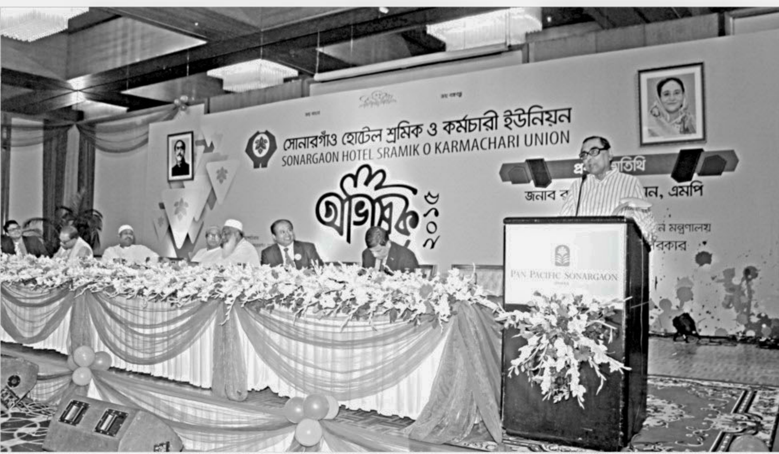
Rashed Khan Menon, civil aviation and tourism minister, speaks at an event to mark the formation of the new executive committee of Sonargaon Hotel Workers Union at the hotel in Dhaka on Thursday. Mujibur Haque, state minister for labour and employment, was also present.

"That is not the end of the story," said German Finance Minister Wolfgang Schäuble. "If there is no implementation it remains