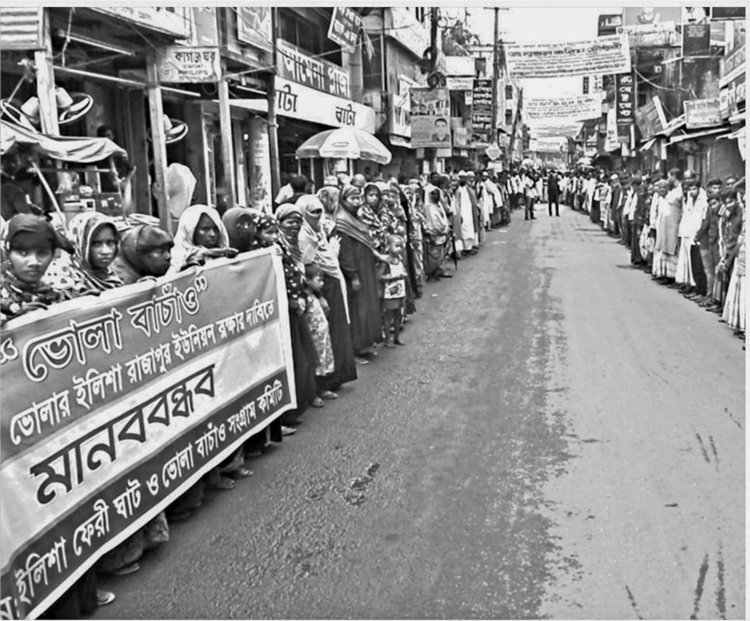
Hundreds of people from different villages in Bhola Sadar upazila join a human chain in front of K Jahan Market in Bhola municipality yesterday demanding effective steps to protect their areas from tidal surges and erosion by the Meghna River.

The reason behind the suicide could not be known immediately, he said.