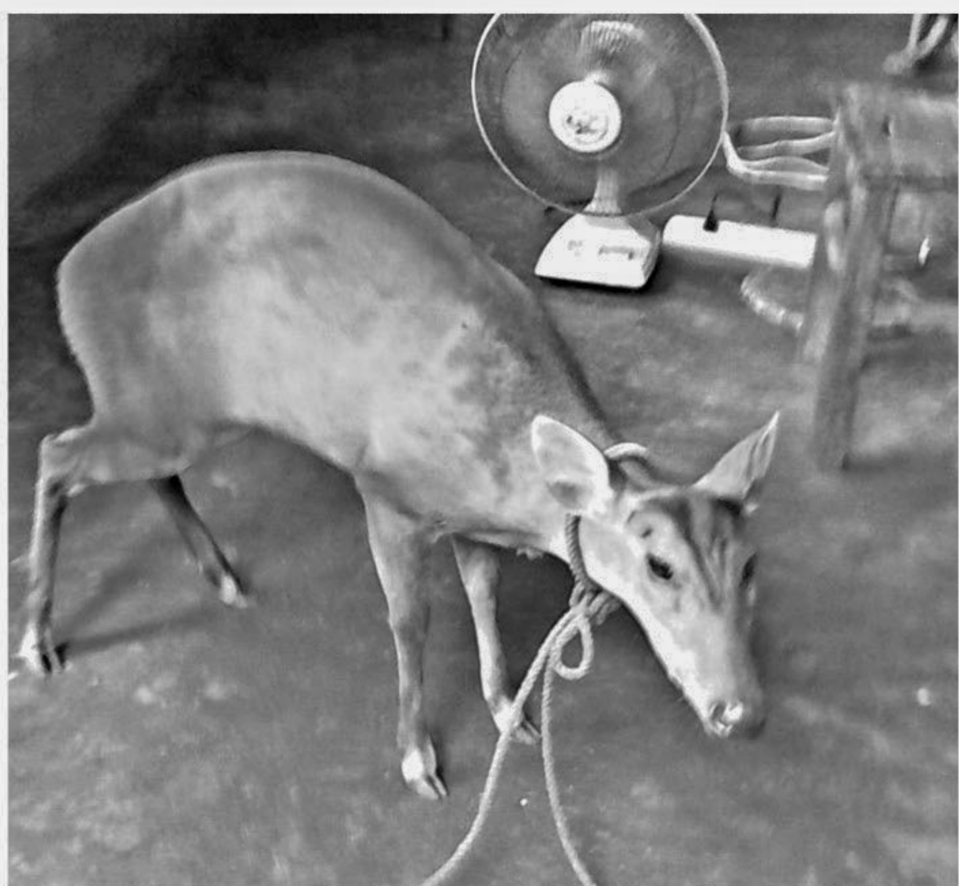
This fawn, rescued by locals at Bogaia Mokam Mahala of Bichhanakandi in Gowainghat upazila under Sylhet district yesterday, was taken to Bichhanakandi camp of Border Guard Bangladesh (BGB). BGB members later handed over the fawn to forest officials for releasing to the wild.

Wishing not to be named, a senior nurse said only two nurses are on-duty at the