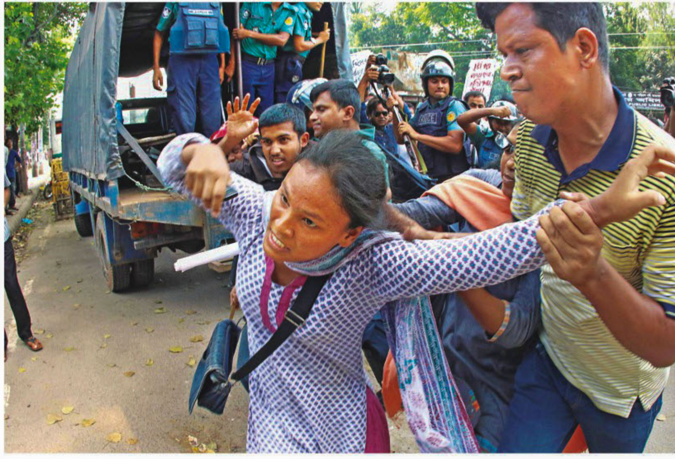
A plainclothes police officer roughs up a Samajtantrik Chhatra Front activist near Shahbagh Police Station in the capital yesterday after members of the leftist student body joined in a demonstration for fresh medical and dental entry tests. Left panel, law enforcers beating and tackling protesters.