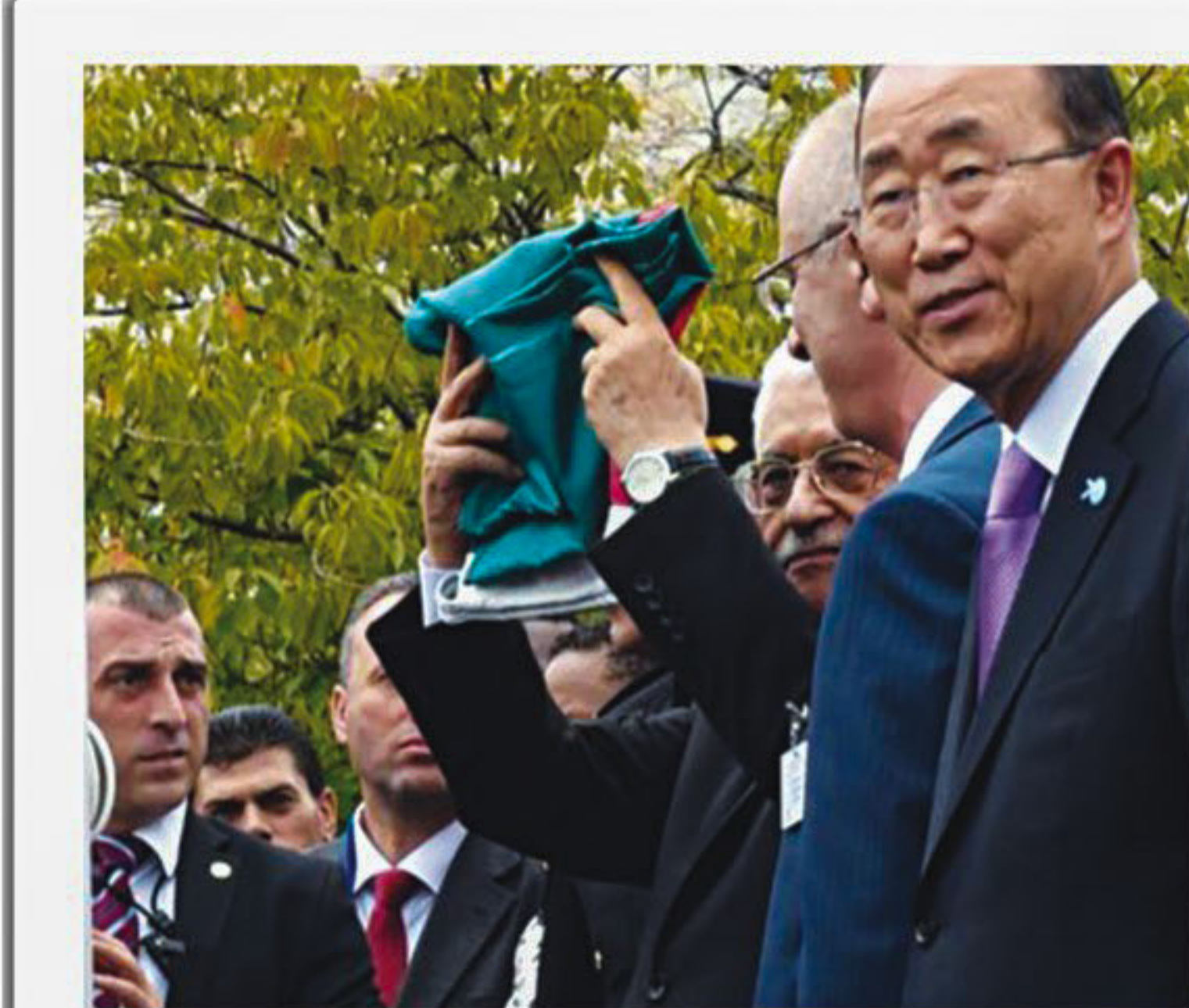
Mahmoud Abbas raises a folded Palestinian flag at the UN headquarters in New York yesterday.