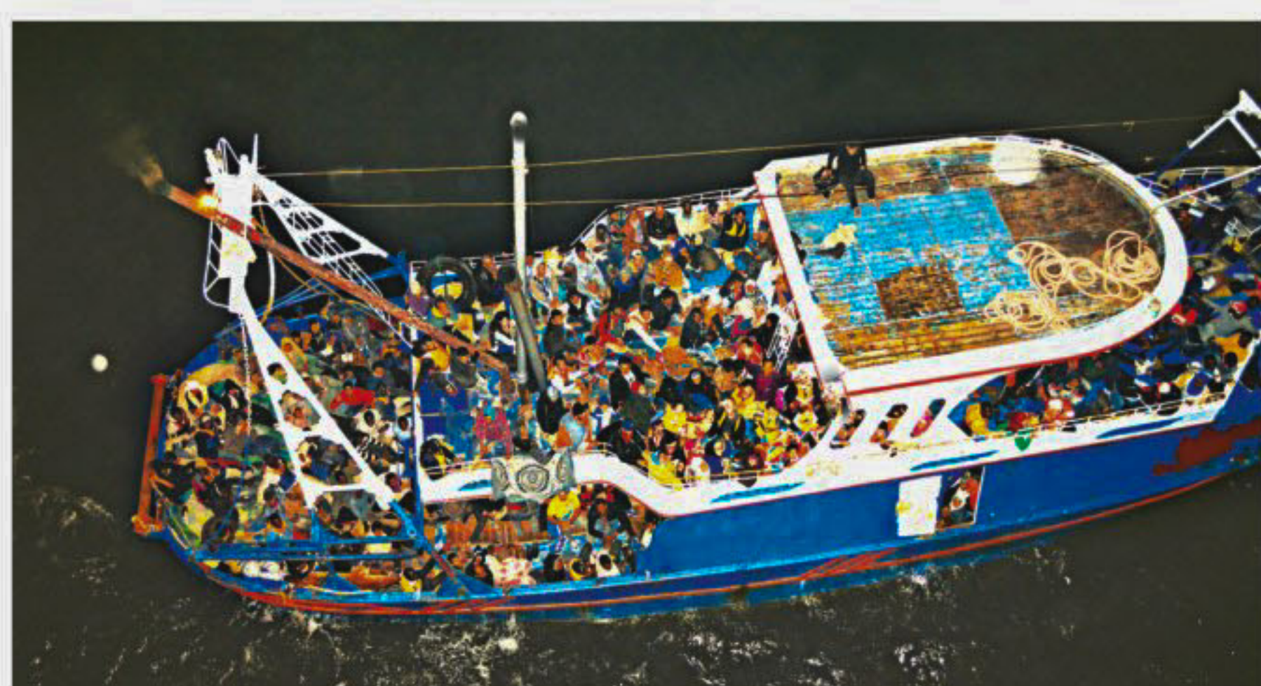
Migrants on a fishing boat found by the commercial ship CS Caprice on October 22, 2014. With about 500 passengers but no food or water, the boat was drifting north of Libya after its skipper abandoned it.