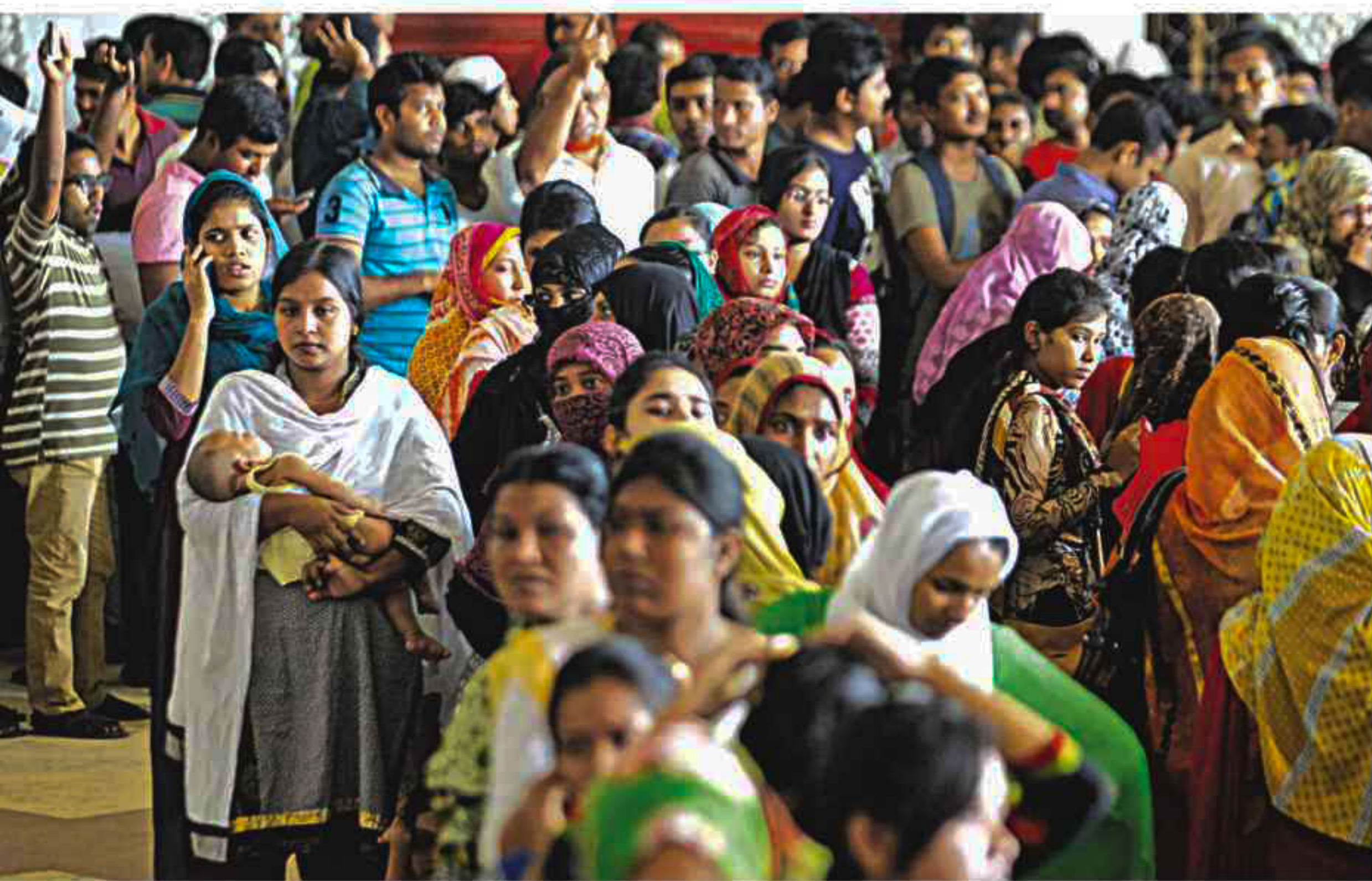
With Eid-ul-Azha only eight days away, hundreds of people endure long queues at Kamalapur Railway Station yesterday to buy advance tickets for their journey home. Although the counters opened at 9:00am, many waited for hours since early morning for their turn to buy tickets.