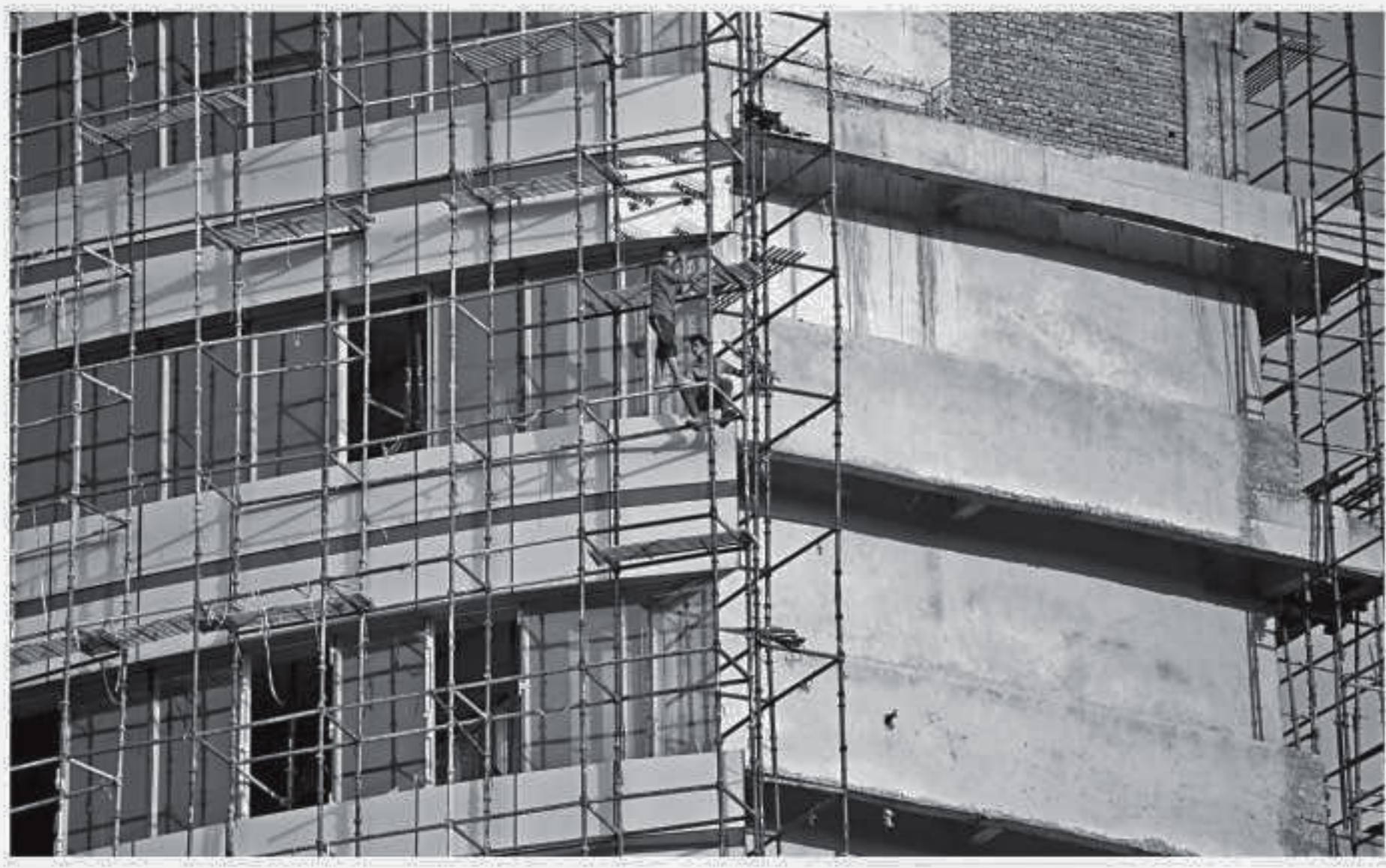
Indian men working at a construction site in Faridabad on the outskirts of New Delhi.

Economists say underlying growth remains fragile, and question whether the re-calculated figures that