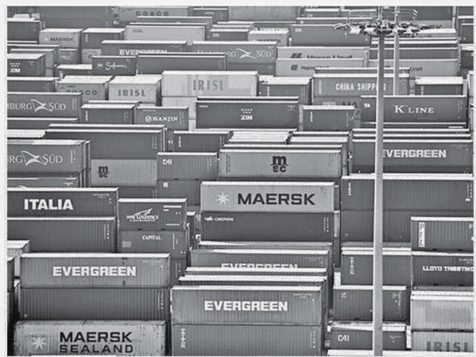
Second-quarter growth for China and South Africa was worse than the most pessimistic forecasts.