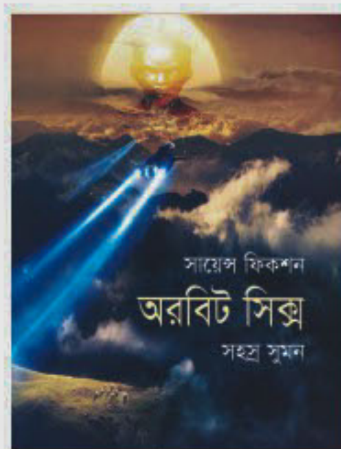
ORBIT SIX Author: Shahasra Sumon Publisher: Shikha Prokashani Price: BDT 175