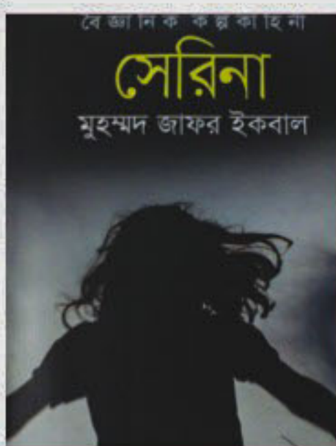
SERINA Author: Muhammad Zafar Iqbal Publisher: Somoy Price: BDT 225