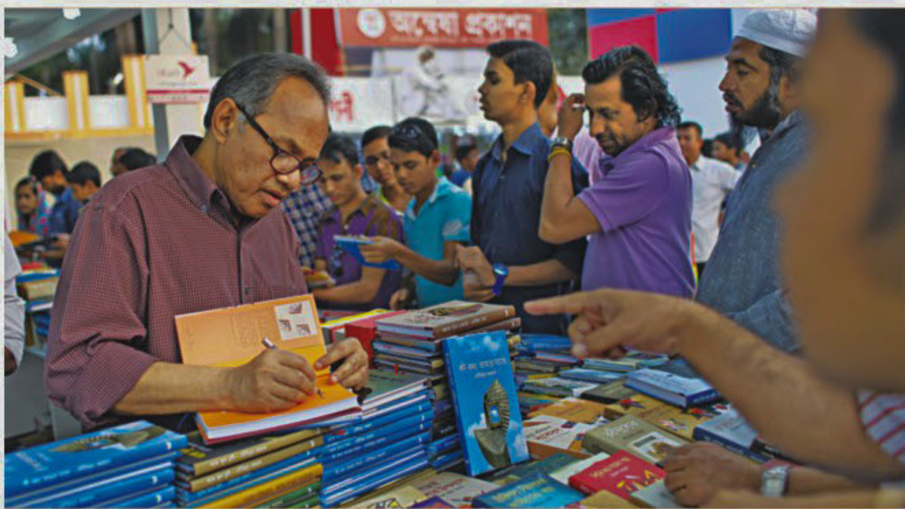
Popular novelist Imdadul Haq Milon signs his books for fans at a stall of Amar Ekushey Granthamela at the capital's Suhrawardy Udyan yesterday. More and more buyers, rather than casual visitors, are flocking to the fair grounds as the month-long event is drawing to a close.