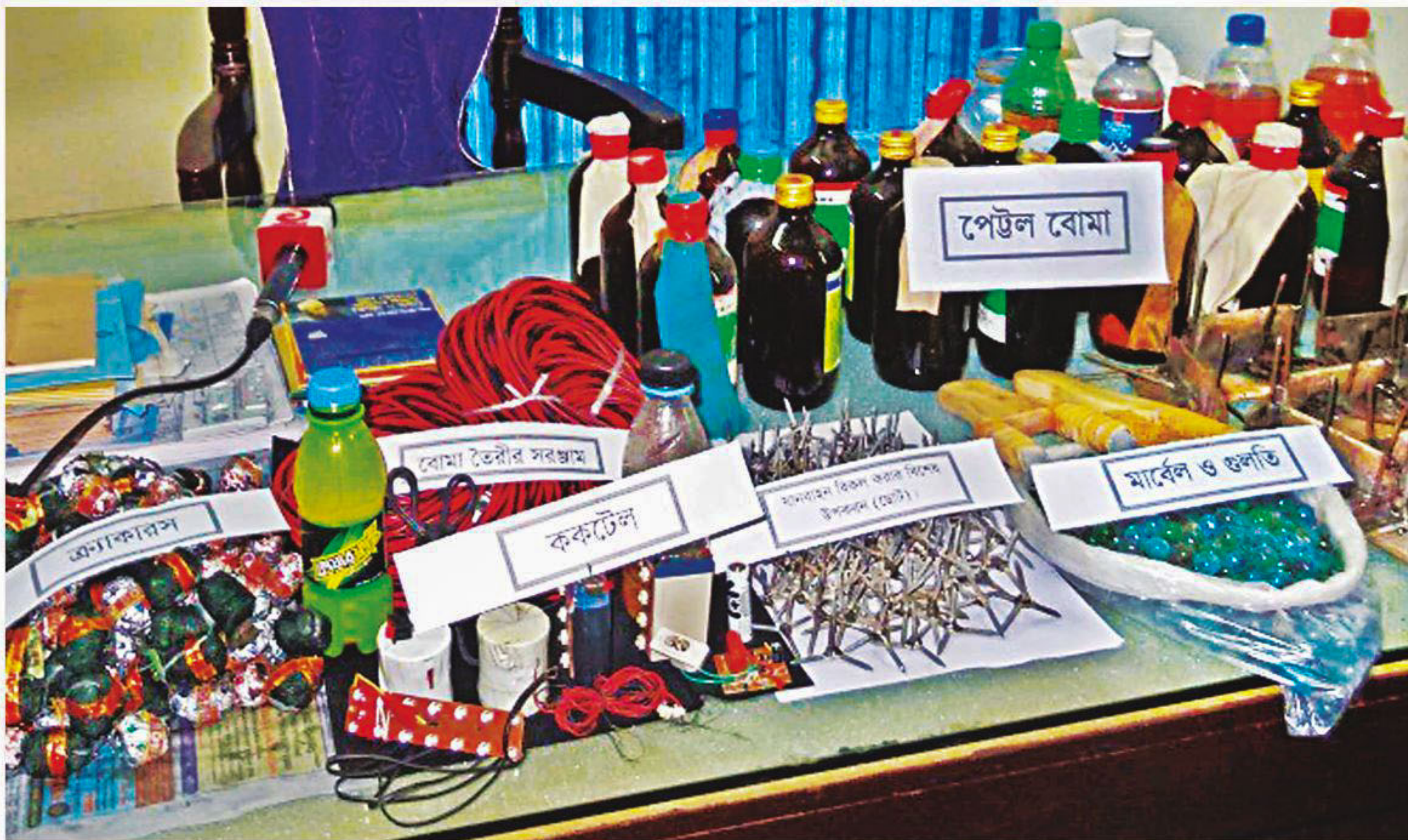
Petrol bombs and bomb-making materials seized in police swoops on several places of Hathazari in Chittagong. Six Islami Chhatra Shibir activists were also detained.