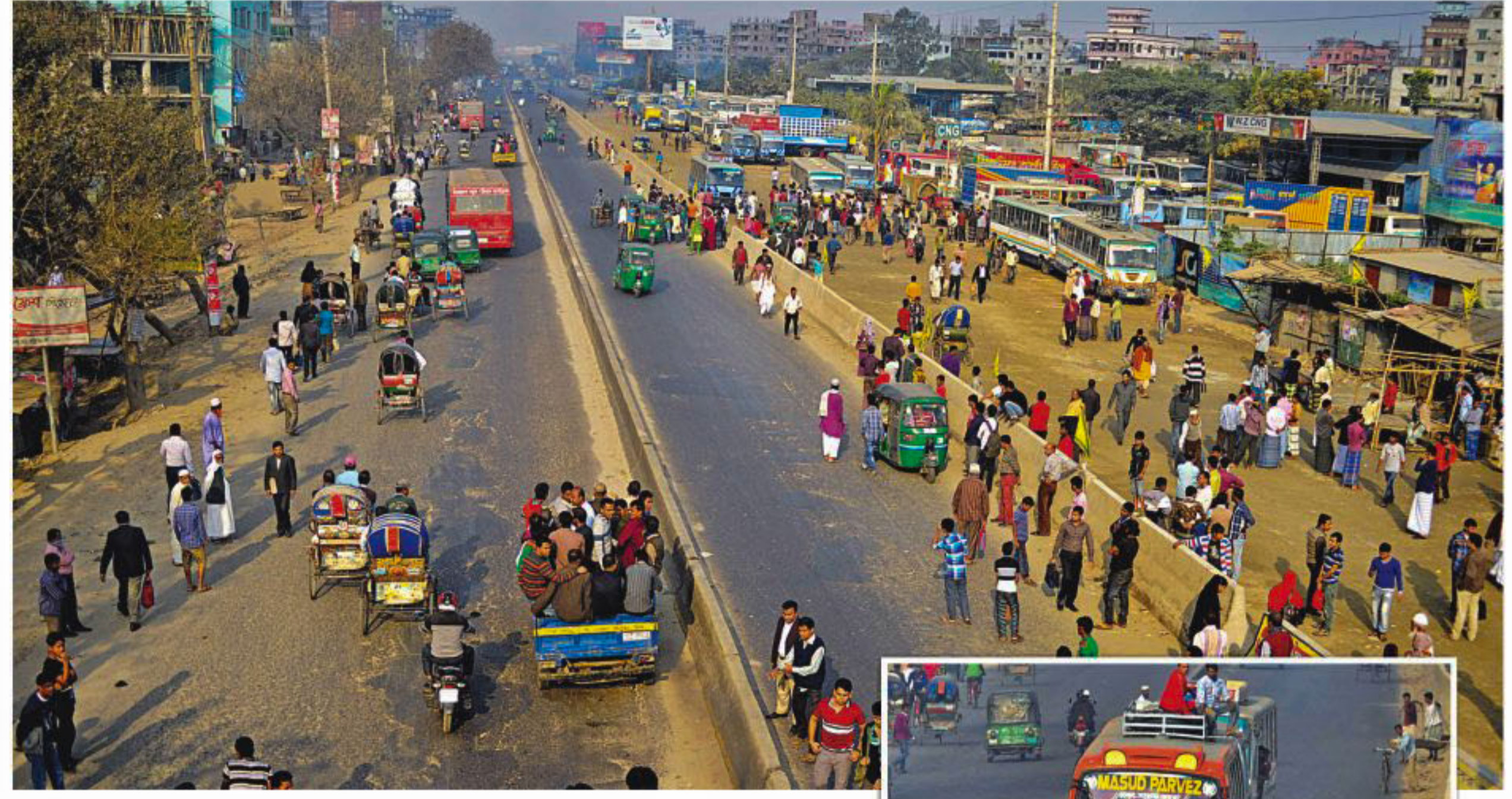
With hardly any public transport on the roads yesterday, the Dhaka-Chittagong highway, the busiest in the country, wears a deserted look in the capital's Kanchpur area. Left, people huddled on a pick-up to get to their destinations. Pro-government activists bar a bus, inset, from entering the city near Kanchpur Bridge.