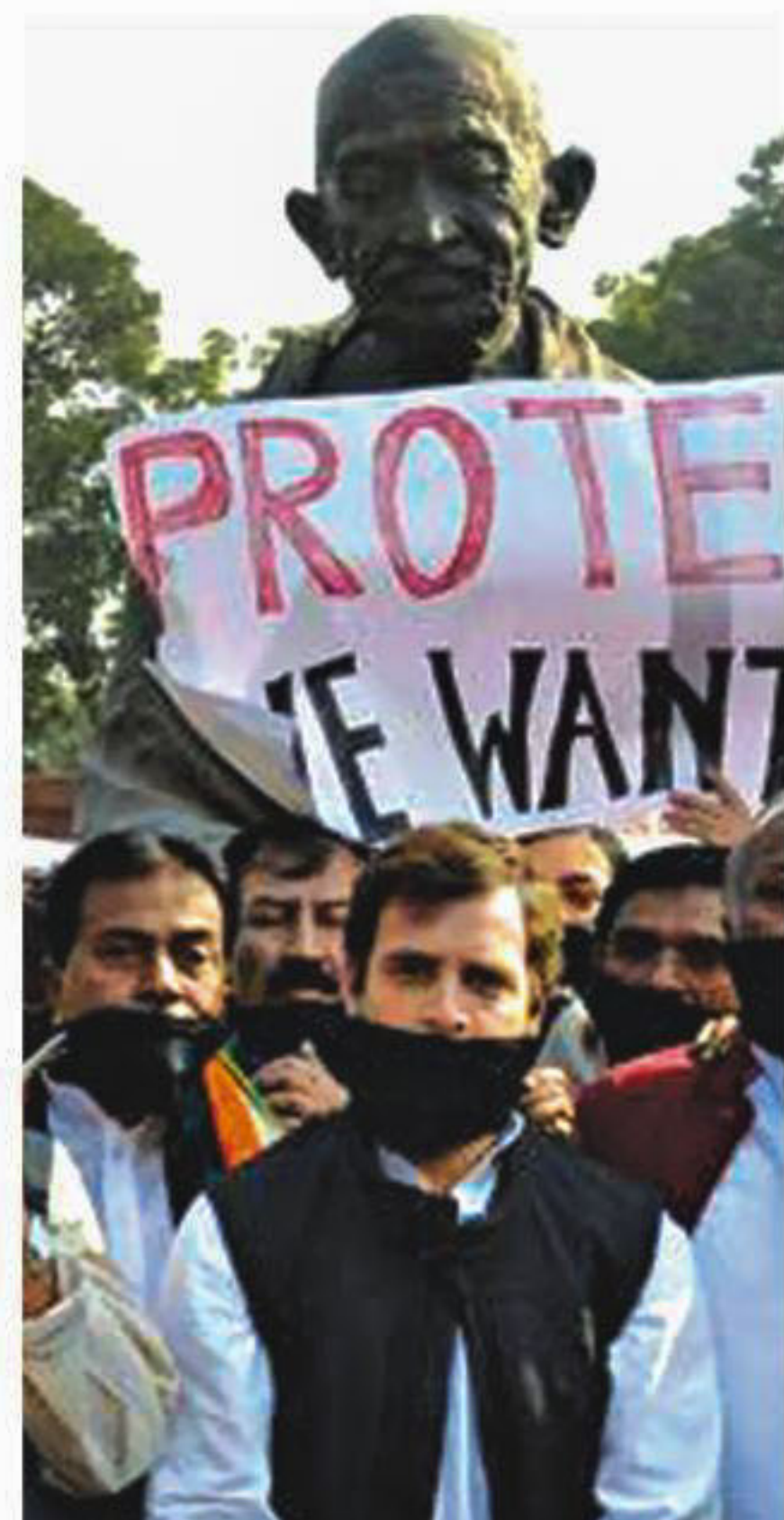
Congress MPs, led by party vice president Rahul Gandhi during a protest at the Parliament House in New Delhi yesterday.