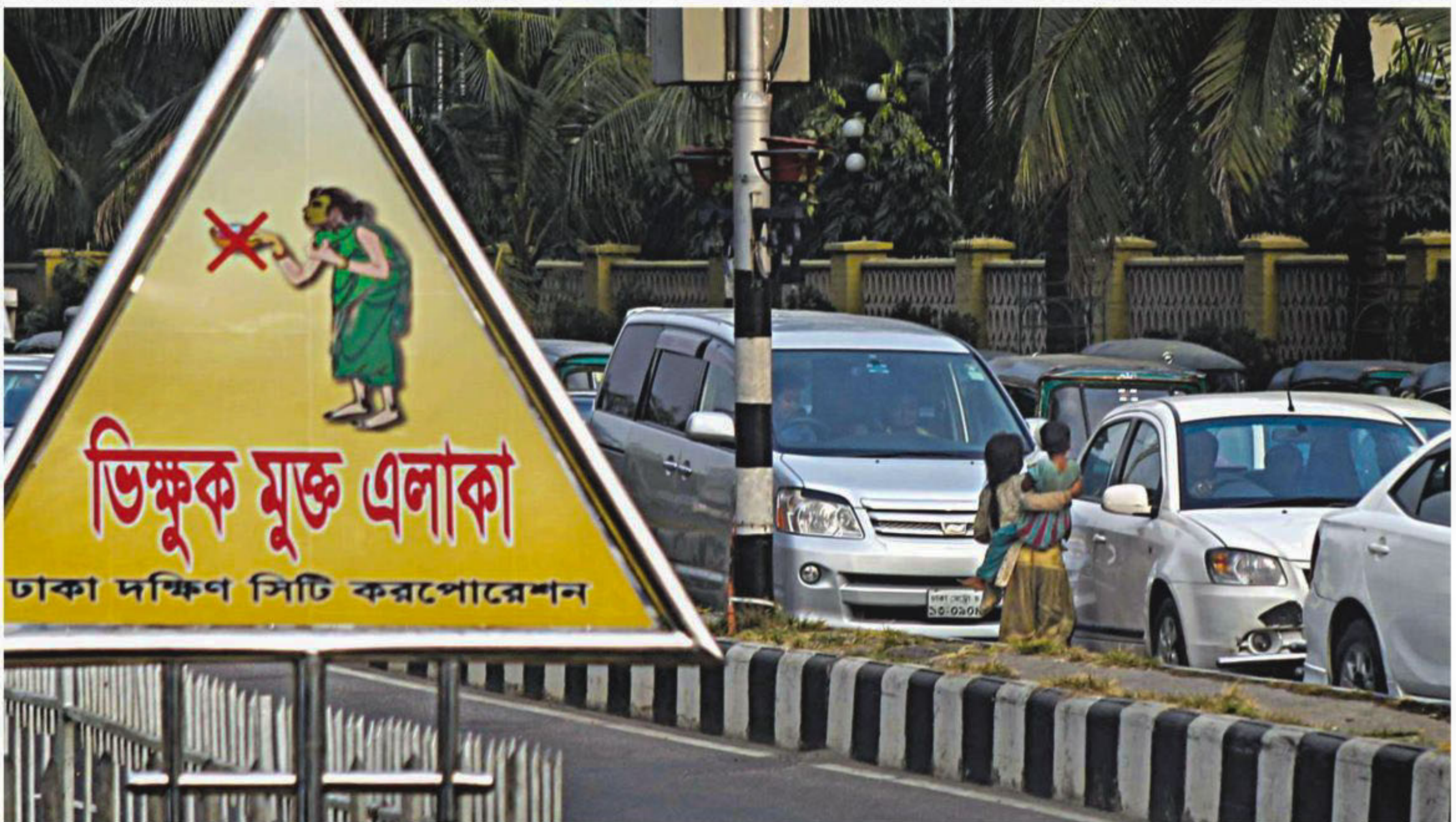
Dhaka South City Corporation has put up a sign at Ruposhi Bangla Hotel intersection declaring it a "beggar-free zone". But beggars, like the one in the picture taken recently, continue to go from car to car seeking alms without resistance.