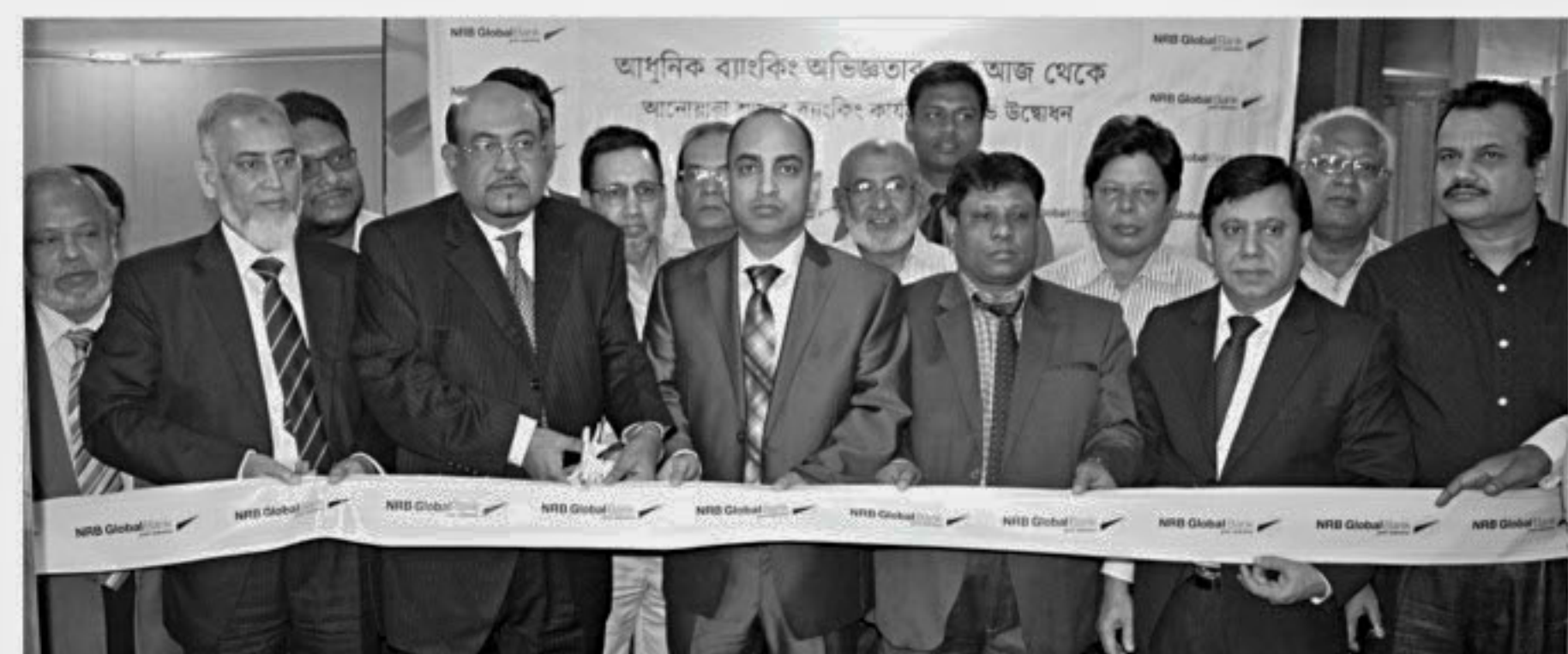
NRB GLOBAL BANK