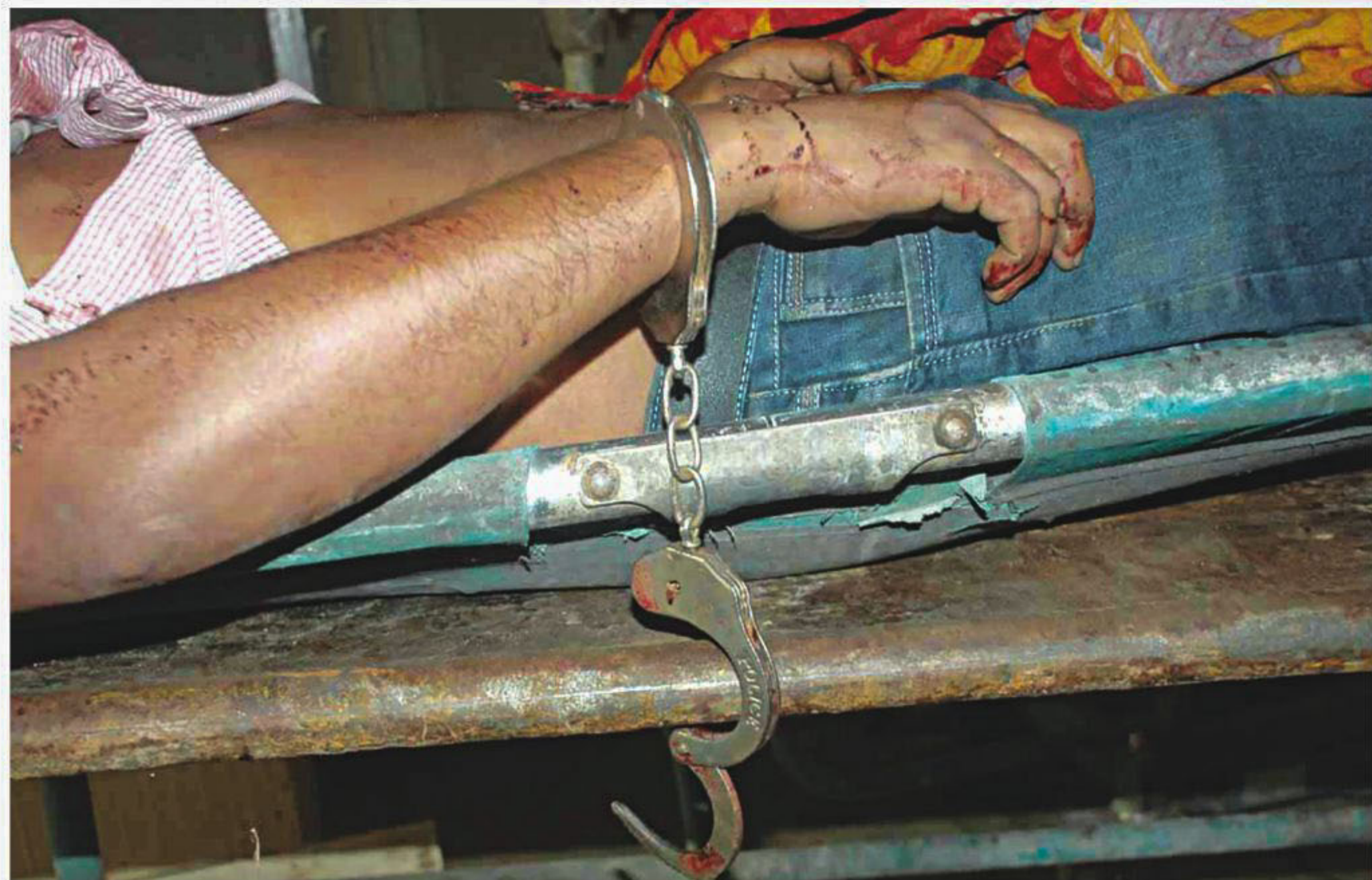
Police yesterday recovered the cuffed body of a driver with bullet wounds at Banasree of Rampura in the capital yesterday. Criminals posing as law enforcers shot him and took away his car.