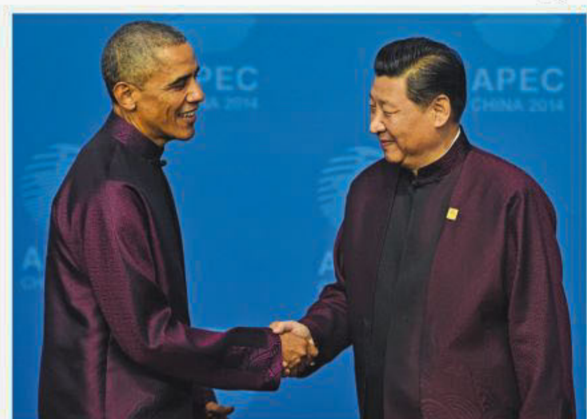
US President Barack Obama is greeted by Chinese President Xi Jinping as he arrives for the APEC Summit banquet in Beijing yesterday.

Obama in Beijing as big-power rivalries take APEC centre-stage