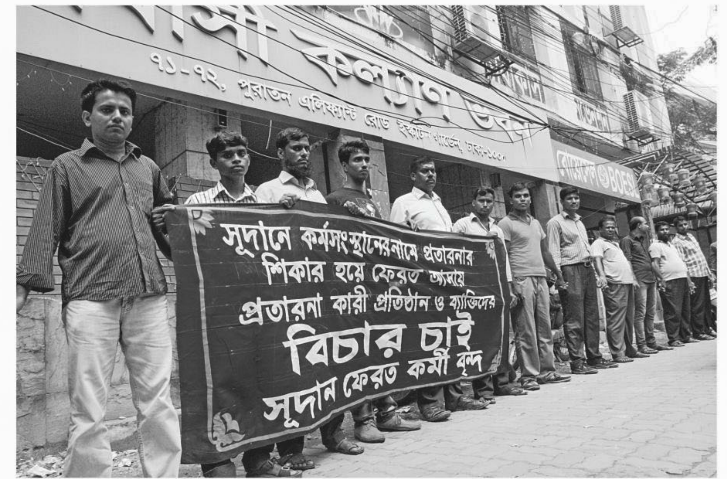
Workers back from Sudan, after being cheated by individuals and organisations in the name of employment, form a human chain in front of the Expatriates' Welfare Building at the capital's Eskaton yesterday demanding trial of the frauds.