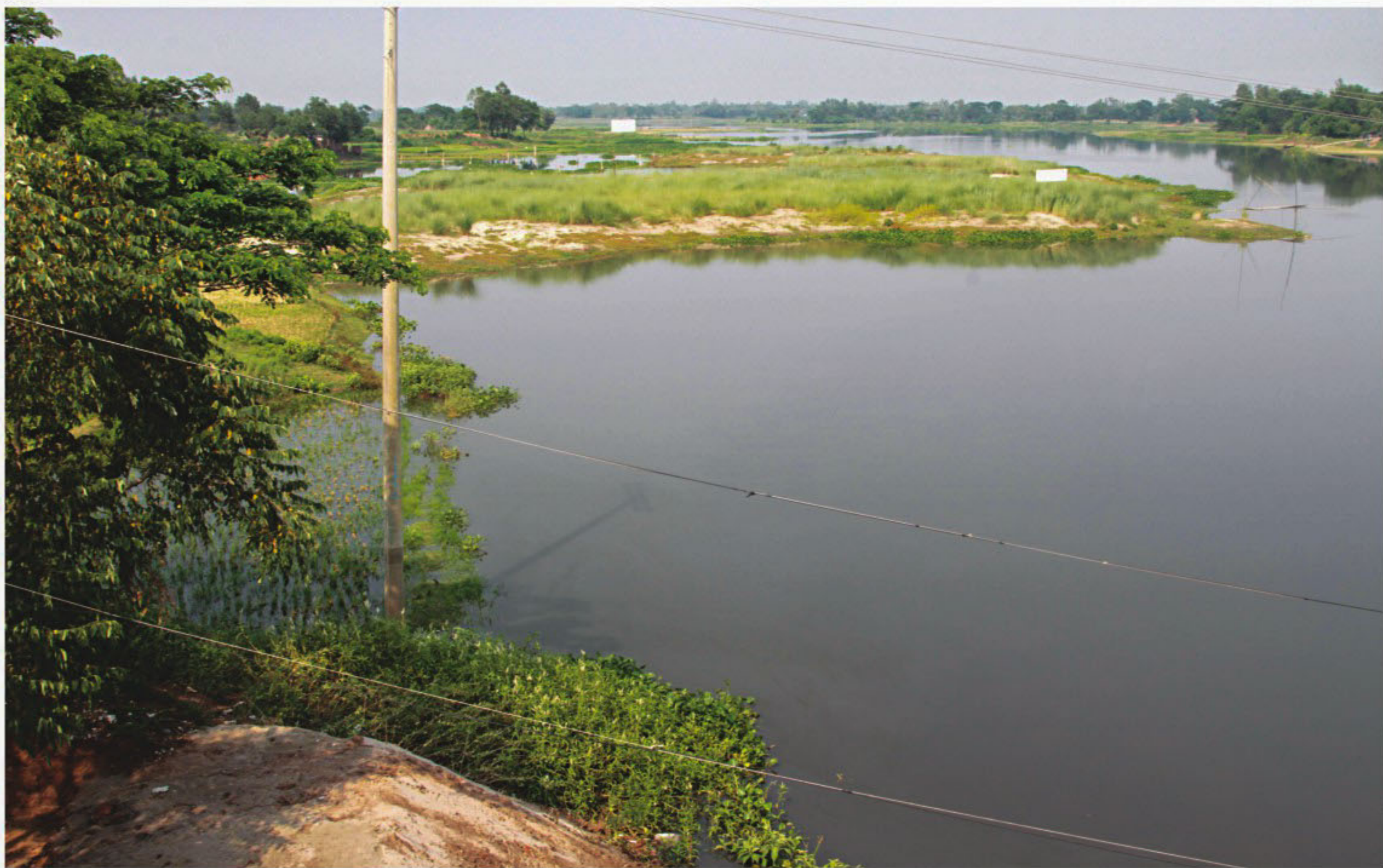
Probashi Polli project, a housing scheme for Bangladeshi expatriates, is seen occupying the Nagda river at Narayankul of Kaliganj in Gazipur. The government has recently made a move to alter the master plan of the capital to help approve 90 acres of land of the proposed project on flood flow zone.