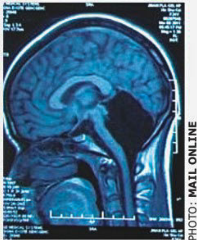
She was born without a cerebellum -- the part of the brain at the base of the skull (shown in the scan as the black space) which is responsible for posture, balance and speech.

Scans revealed the woman had been born with a cerebellum - the part of the brain responsible for posture, balance, motor learning like kicking a ball, and speech.