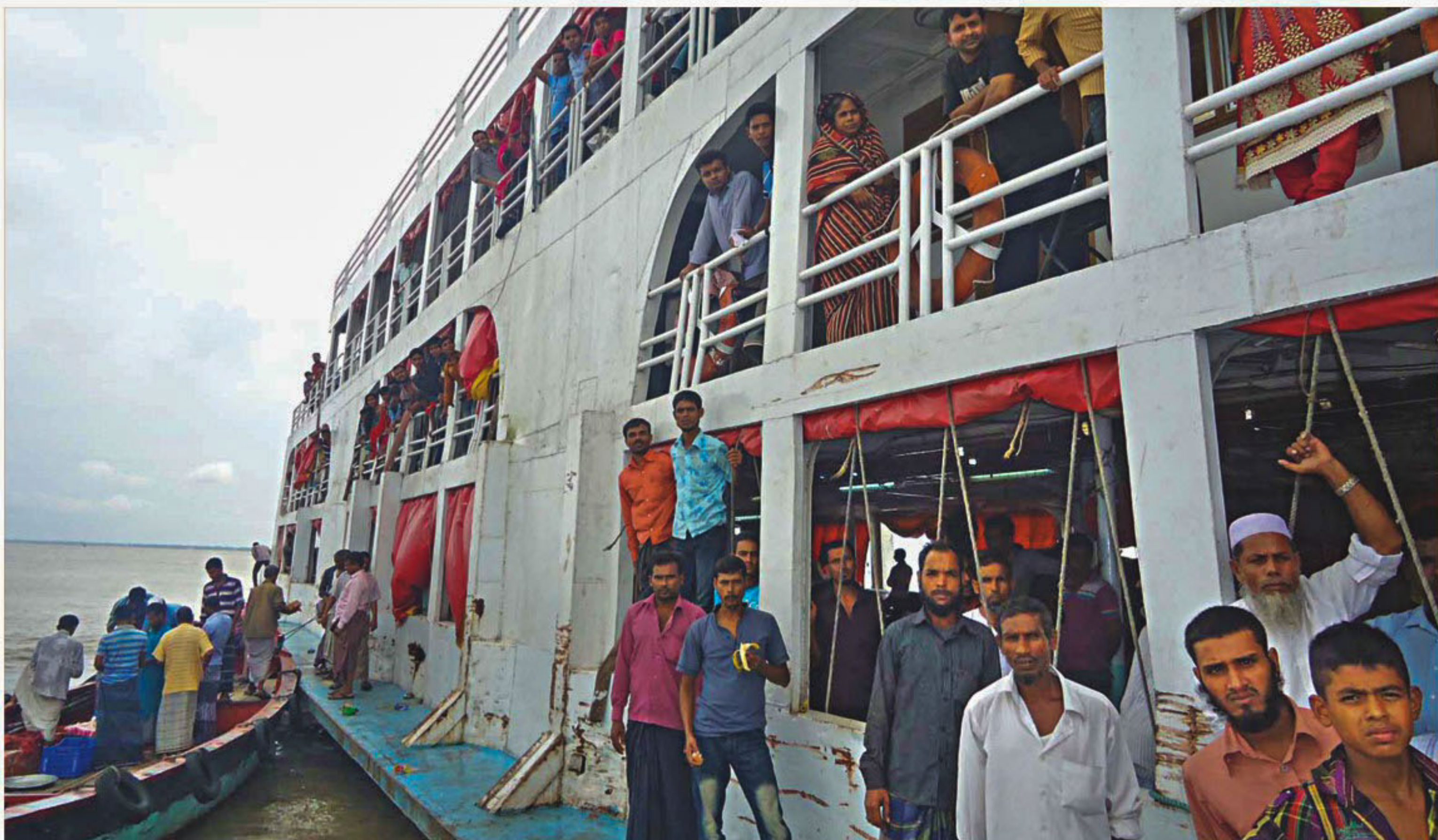
MV Sattar Khan-1 stuck in a char in the Meghna near Chandpur. The vessel had left Dhaka for Patuakhali on Friday evening and got stranded in the middle of the river later that night. The passengers are seen being rescued yesterday afternoon.