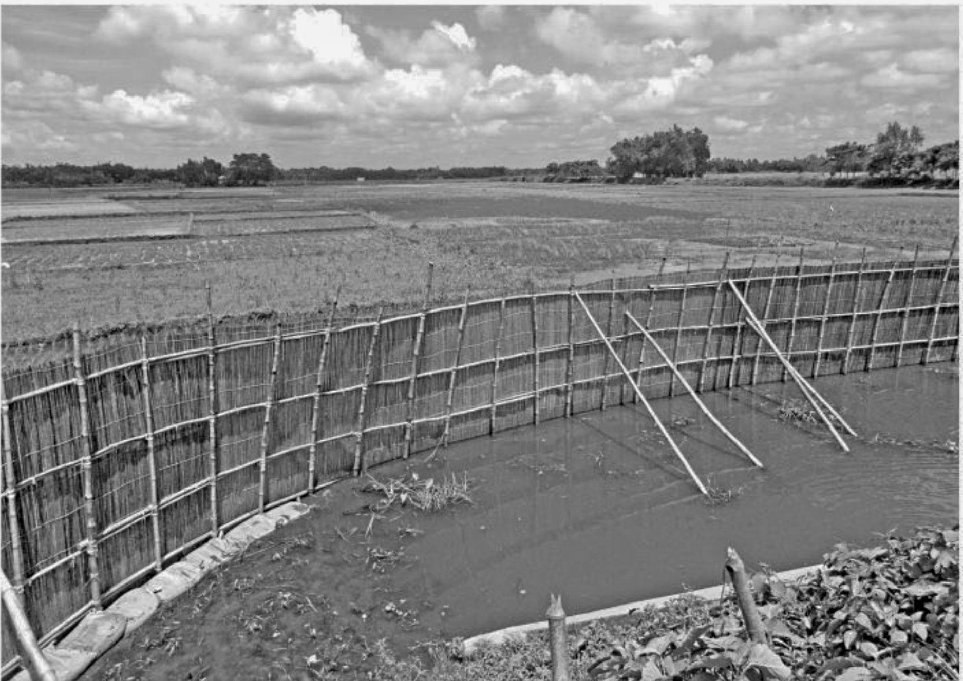
This bamboo fence, illegally erected by local BNP men in Dulai Beel (water body) for fish farming in June this year at Falimari village in Aditmari upazila of Lalmonirhat, was removed yesterday morning following a court order.

A mobile court yesterday morning sentenced 12 fishermen to three months' imprisonment each for catching fish from a water-body at Patul Ghat in Naldanga upazila defying a ban during the current monsoon. The court conducted a drive in Haldi Beel (water body) area and arrested the 12 fishermen while they were catching fish.