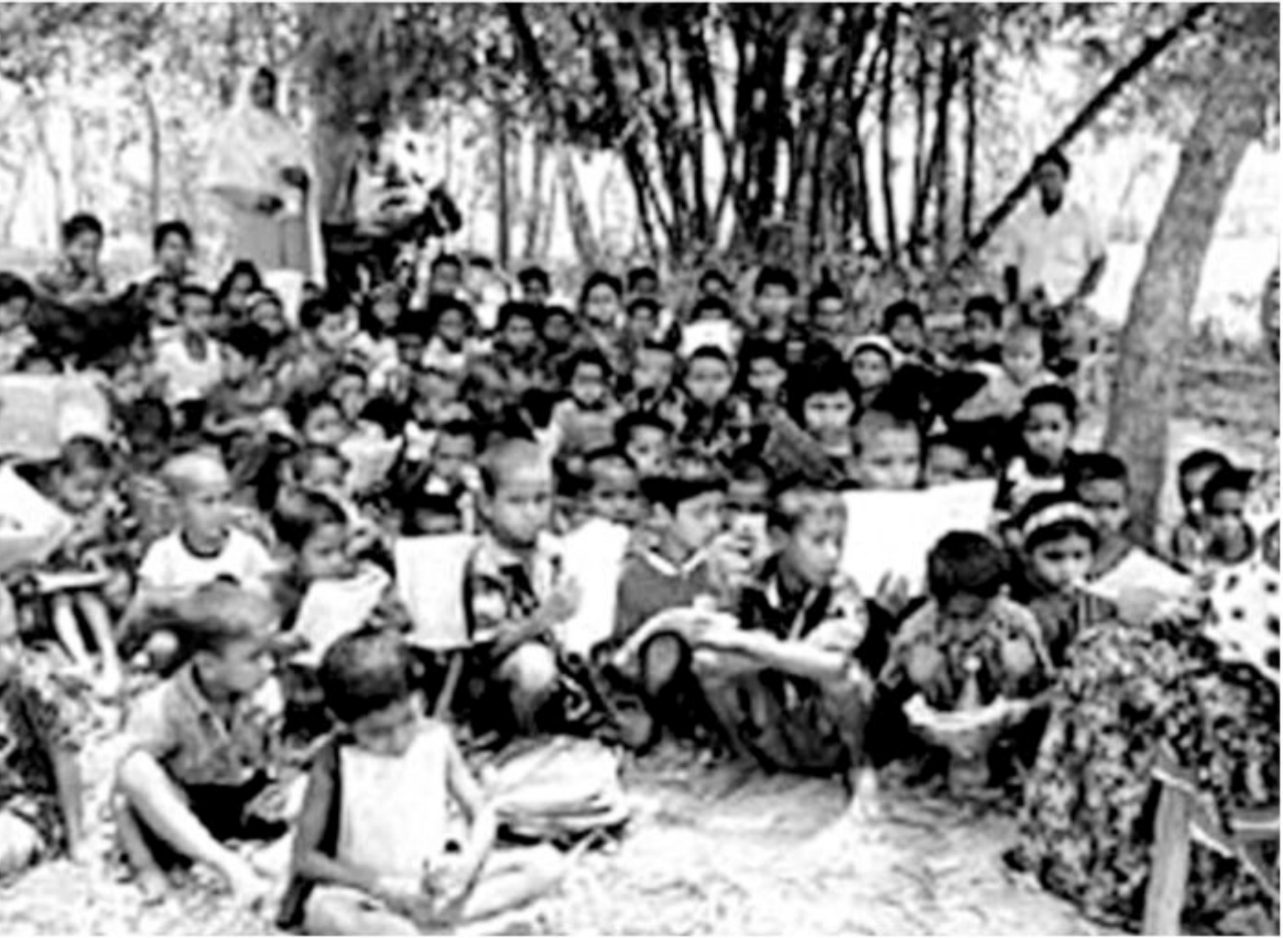
Students of Narayanpur Government Primary School in Gobindapur upazila of Gaibandha attend classes under the open sky as the schoolhouse, damaged during nor'wester last month, is yet to be repaired.