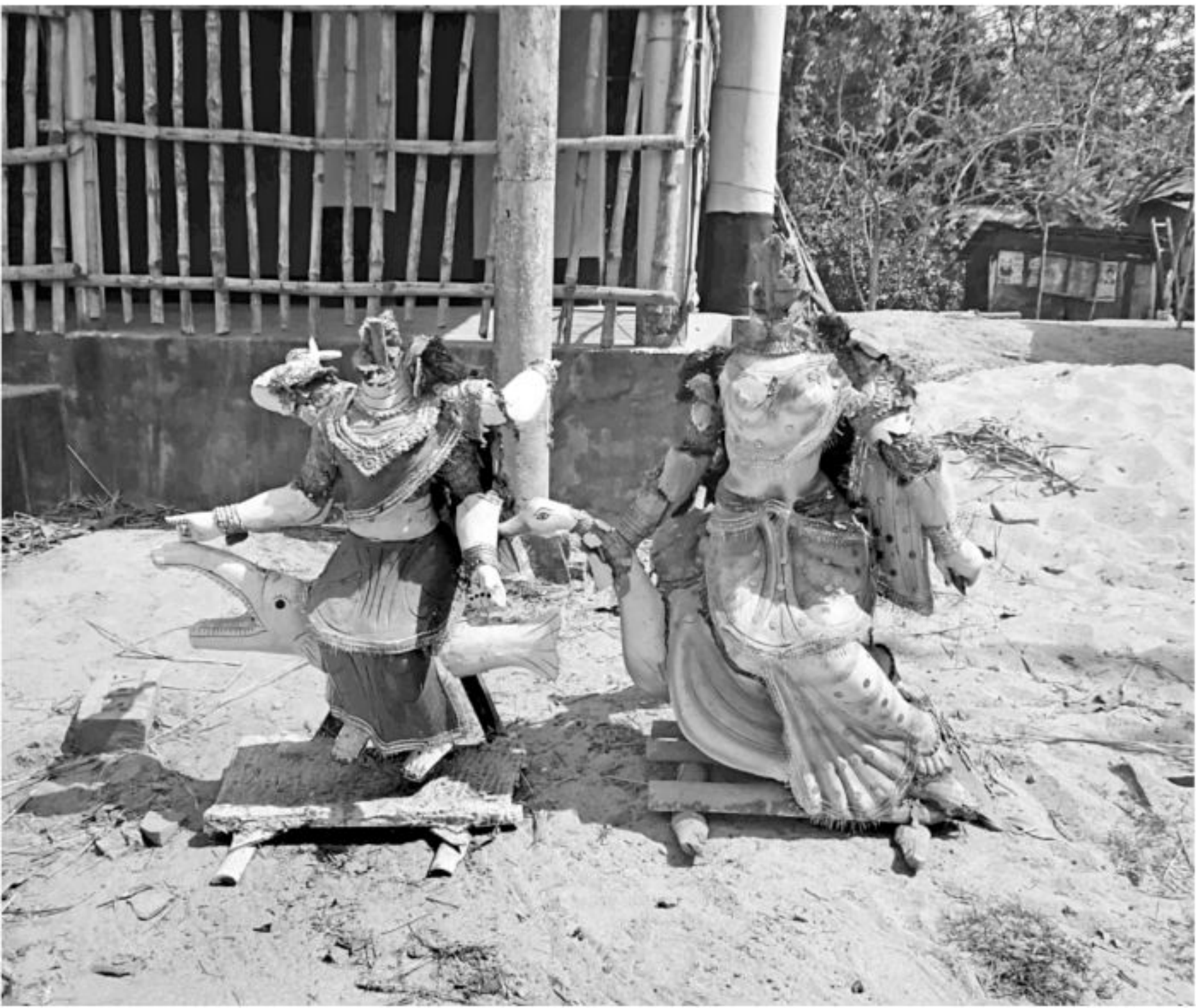
Unknown criminals vandalise two idols at Durga Temple at Nawapara village in Lalpur village of Natore district on Tuesday night.