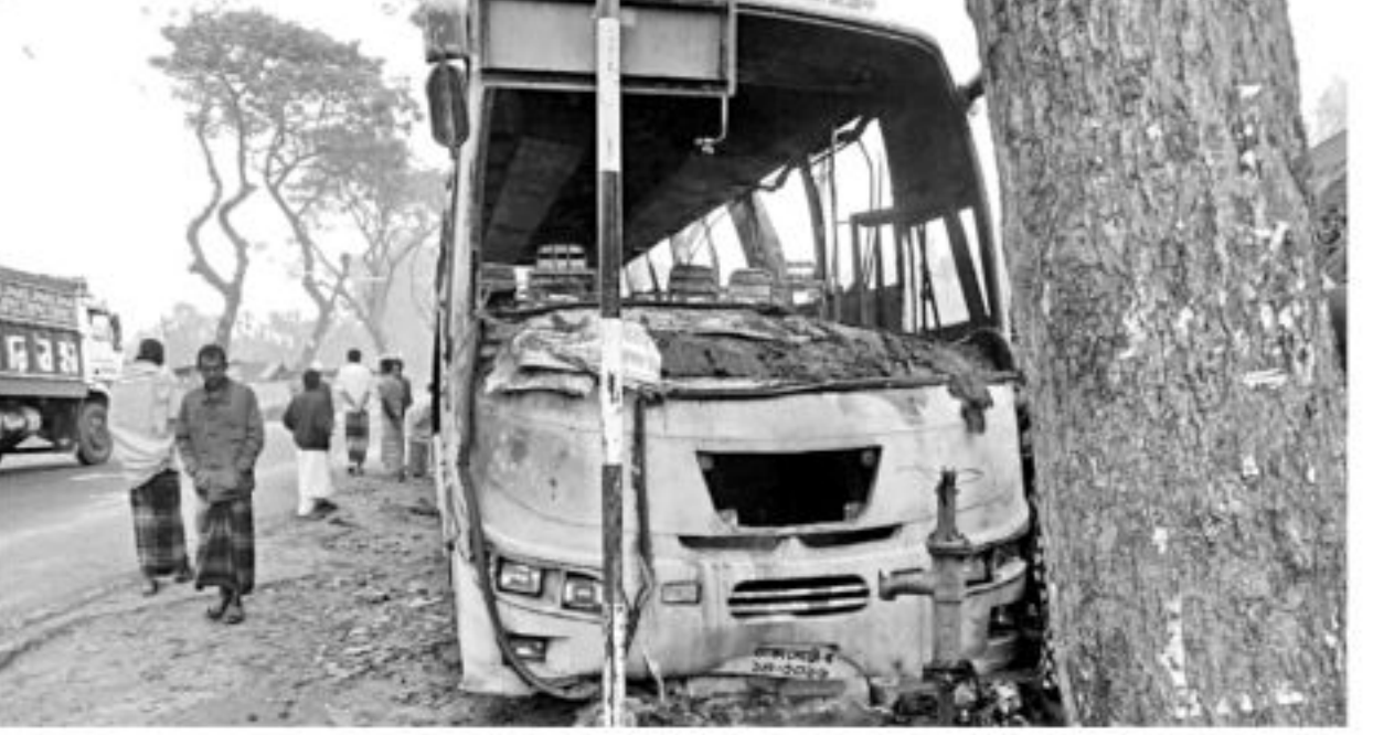
Gas cylinder of this bus exploded near the Brac office on Rangpur-Dinaipur road in Palashbari upazila under Gaibandha district on Monday night, causing burn injuries to 35 passengers.

OUR CORRESPONDENT, Gaibandha At least 35 passengers of a CNG-run night coach sustained burn injuries as a gas cylinder of the vehicle exploded near Brac office at Palashbari on Rangpur-Bogra highway on Monday. Police and locals said as soon as a Comilla-bound Saikat Paribahan reached the area around 9:30pm, a gas cylinder at the bottom of chassis exploded with a big bang. As the fire broke out in