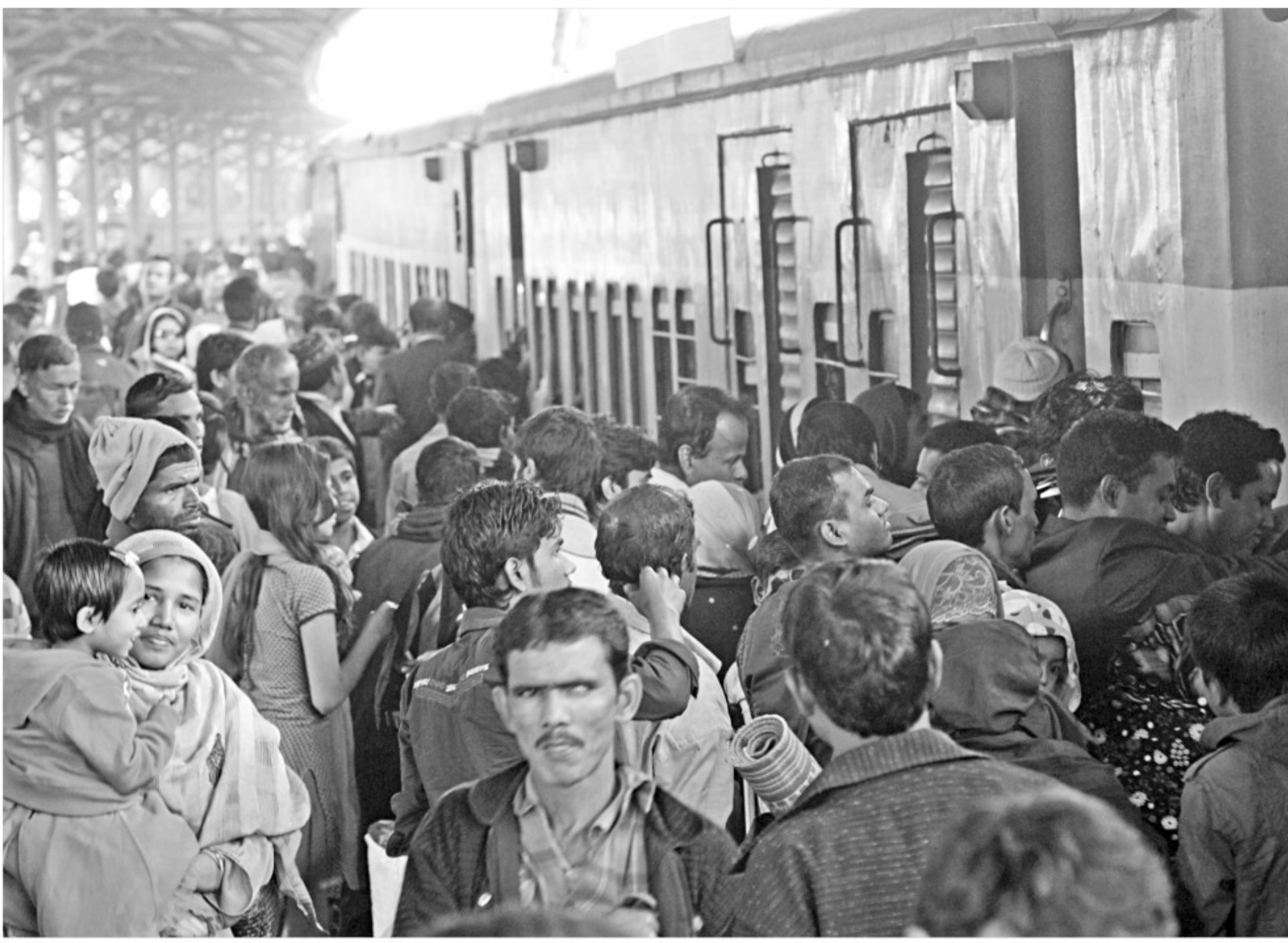
People throng Airport Railway Station in the capital yesterday as inter-district buses sat idle due to the ongoing indefinite blockade and 48-hour hartal of the BNP-led opposition alliance.