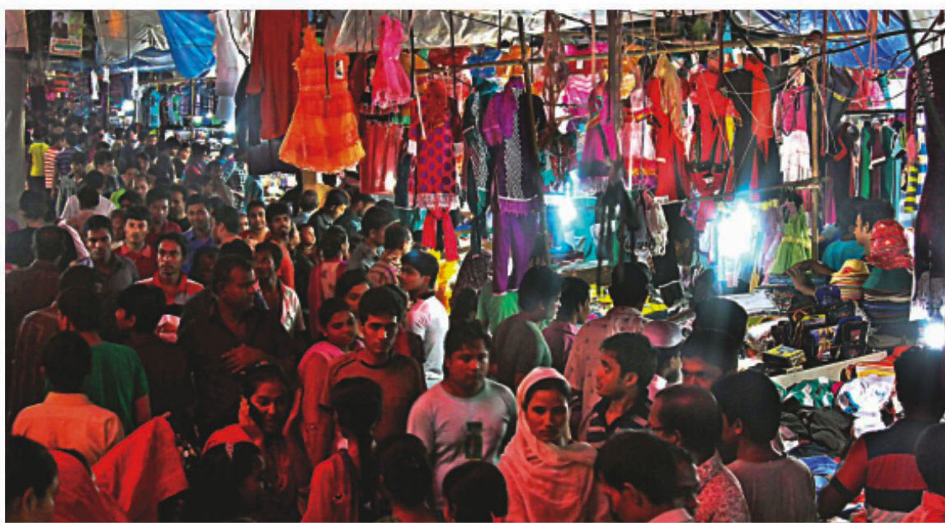
It is 11:30pm but shoppers still crowd the pavement of Farmgate just in front of Tejgaon College in the capital yesterday doing their Eid shopping.

Amid the fallout of a deadly garment-factory collapse in April, Bangladesh faces a more immediate economic threat from the massive strikes known as "hartals," which are bringing the country to its knees with disturbing, and rising, frequency. In one such strike last month, protesters attacked buses, blocked roads and detonated homemade bombs, while at least five people died in clashes with police. Dhaka businesses saw revenue nosedive as shoppers stayed home. Even mango vendors suffered, as supplies from the countryside dwindled with roadways under threat of violence. At the Pan Pacific Sonargaon, a popular business hotel, staff slipped notes under visitors' doors advising of the suspension of "all vehicular movement" during strikes and warning guests not to venture off the property. Guests needing to go to the airport were ferried in a shuttle bus with armed SEE PAGE 11 COL 5