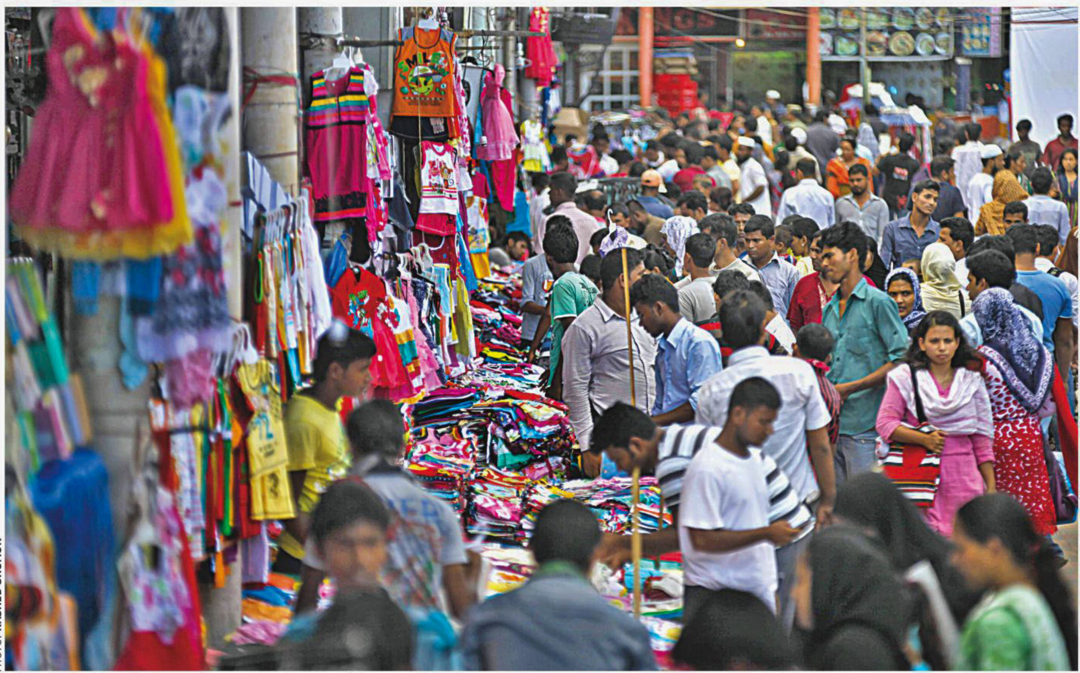
Eid shoppers busy looking for their favourite items of clothing in New Market of the capital yesterday. As Eid approaches, city dwellers swarm the shopping malls every day.