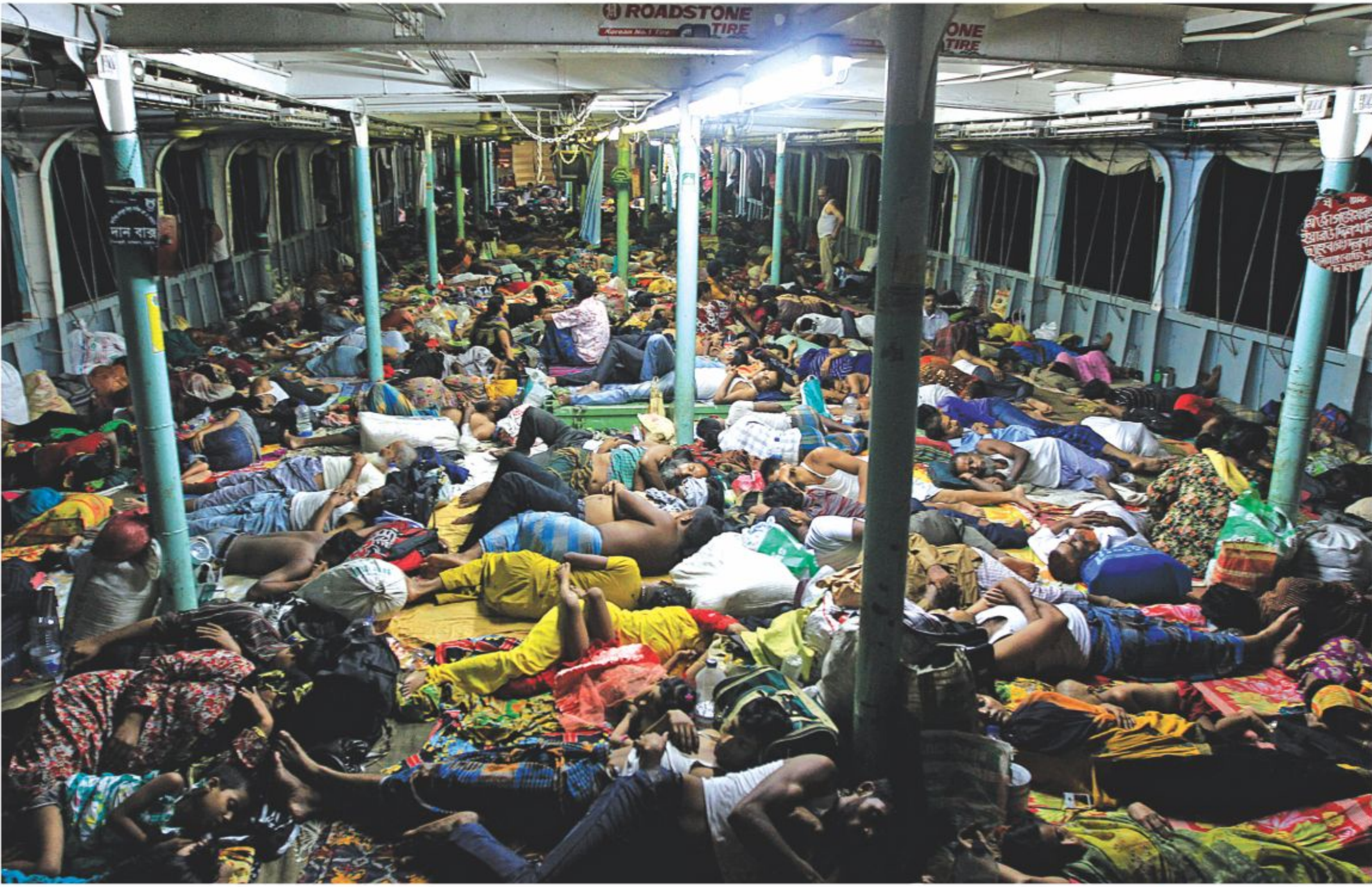
Passengers cram into the deck of a launch coming to Dhaka from Barisal yesterday. Many of them travelled all the way home only to vote in the Barisal City Corporation elections held on Saturday.