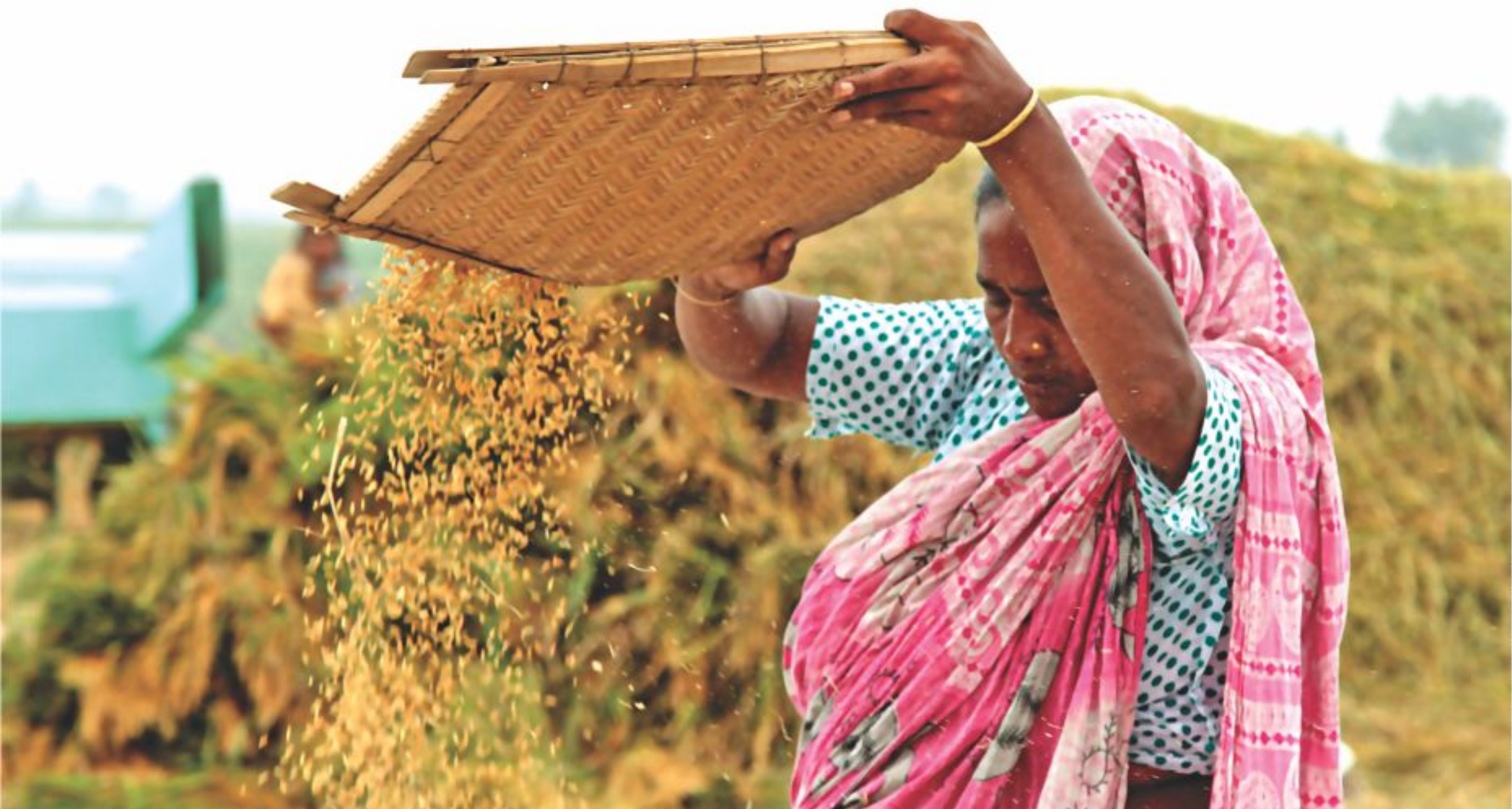
A woman winnowing paddy, freshly harvested in this Boro season, at the capital's outskirts Aminbazar on Sunday.