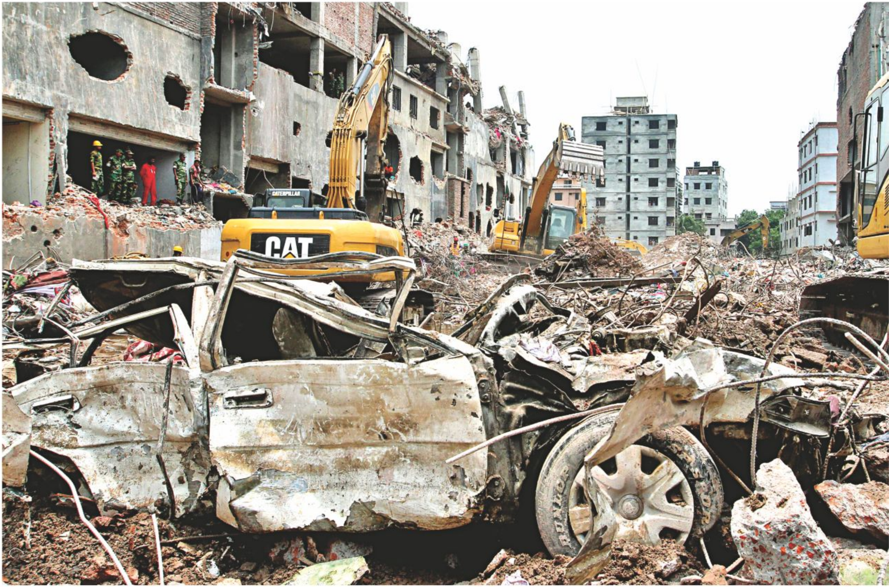
Hard to believe the photo is not of a war-torn distant country where a car bomb had gone off. The photo is of the collapsed Rana Plaza in Savar after the army cleared out the basement of the ill-fated building and ended the rescue operations yesterday.