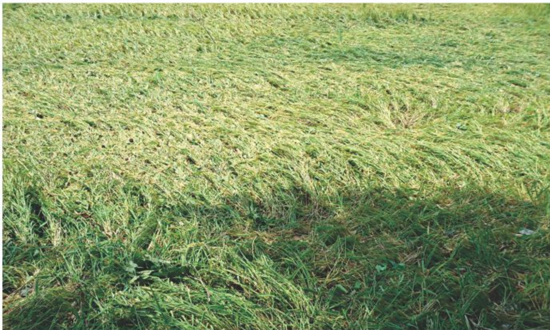
The entire crop on this paddy field in Ramdubi in Dinajpur was flattened by a nor'wester that struck the region early yesterday.