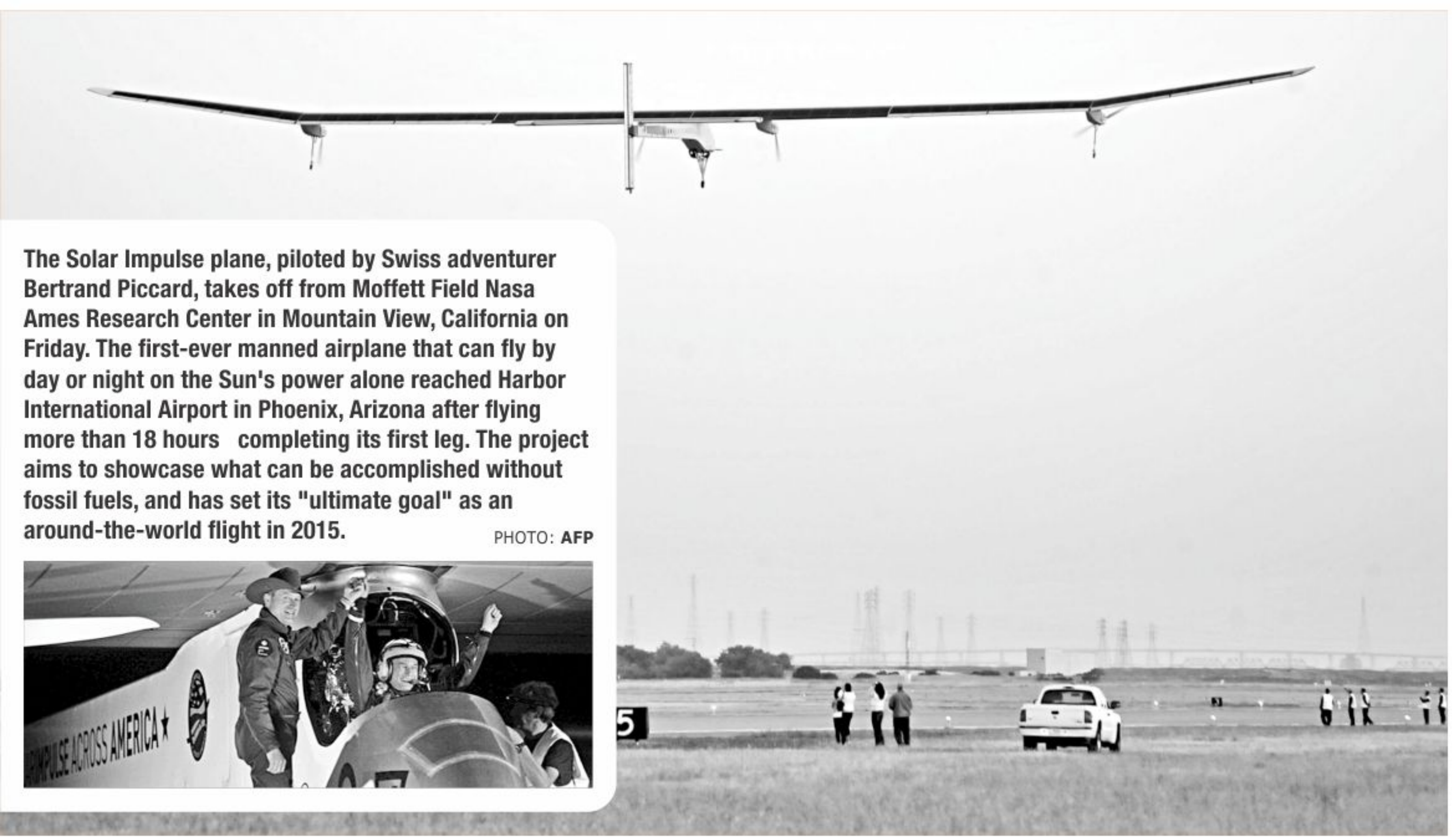
The Solar Impulse plane, piloted by Swiss adventurer Bertrand Piccard, takes off from Moffett Field Nasa Ames Research Center in Mountain View, California on Friday. The first-ever manned airplane that can fly by day or night on the Sun's power alone reached Harbor International Airport in Phoenix, Arizona after flying more than 18 hours completing its first leg. The project aims to showcase what can be accomplished without fossil fuels, and has set its "ultimate goal" as an around-the-world flight in 2015.