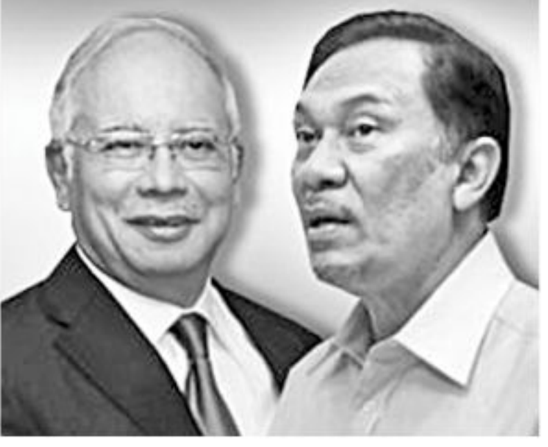
Najib Razak Anwar Ibrahim

Malaysia's bitter political rivals launched a last-ditch campaign sprint yesterday on the eve of the first elections in the country's history in which the long-ruling regime faces possible defeat. Malaysia's premier Najib Razak and opposition leader Anwar Ibrahim barnstormed through their home regions where they will cast their own ballots today in elections marred by violence and allegations of government vote fraud. The opposition has set the stage for a possibly destabilising challenge to the results, accusing the Barisan Nasional (National Front) coalition of attempting to rig the result. Anwar Ibrahim said only fraud can stop his Malaysian opposition from scoring a historic election win. The ethnic Malay-dominated regime has tightly held power in the multi-racial nation since independence in 1957, steering it from a backwater to an economic success. But its grip is slipping amid rising anger over corruption, controversial policies favouring Malays and authoritarian tactics. A survey released Friday indicated the result was too close to predict, with Barisan and the opposition Pakatan Rakyat (People's Pact) alliance roughly equal in terms of support but with a large undecided bloc. "This election is an election of the people fighting oppressive and corrupt rulers," Anwar told a cheering crowd in a campaign stop in northern Malaysia late Friday.