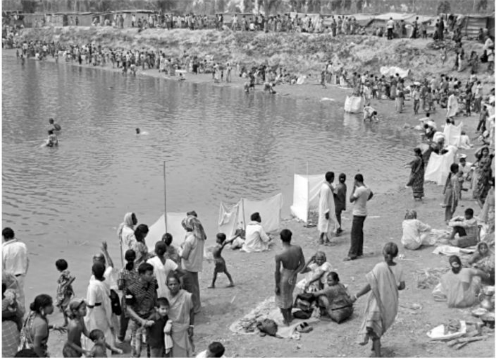
Hindu devotees, who came to Sindurmoti Mela (fair) held on the bank of Sundurmoti pond in Lalmonirhat Sadar upazila on Saturday, bath in the pond to get rid of all sins.