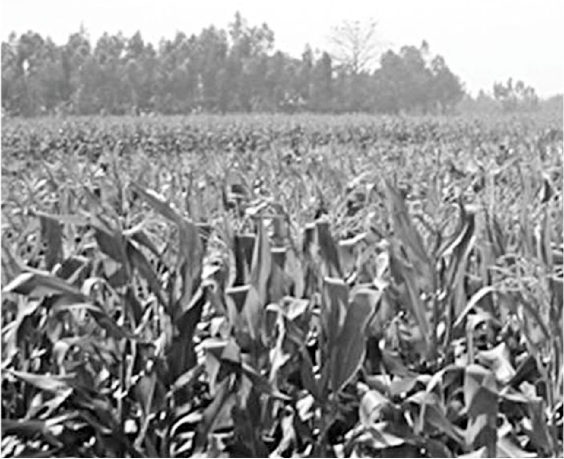
A vast maize field on the Karatoa river basin in Pirganj upazila of Rangpur. Eight districts under Rangpur division are expecting a bumper yield of the crop this season.