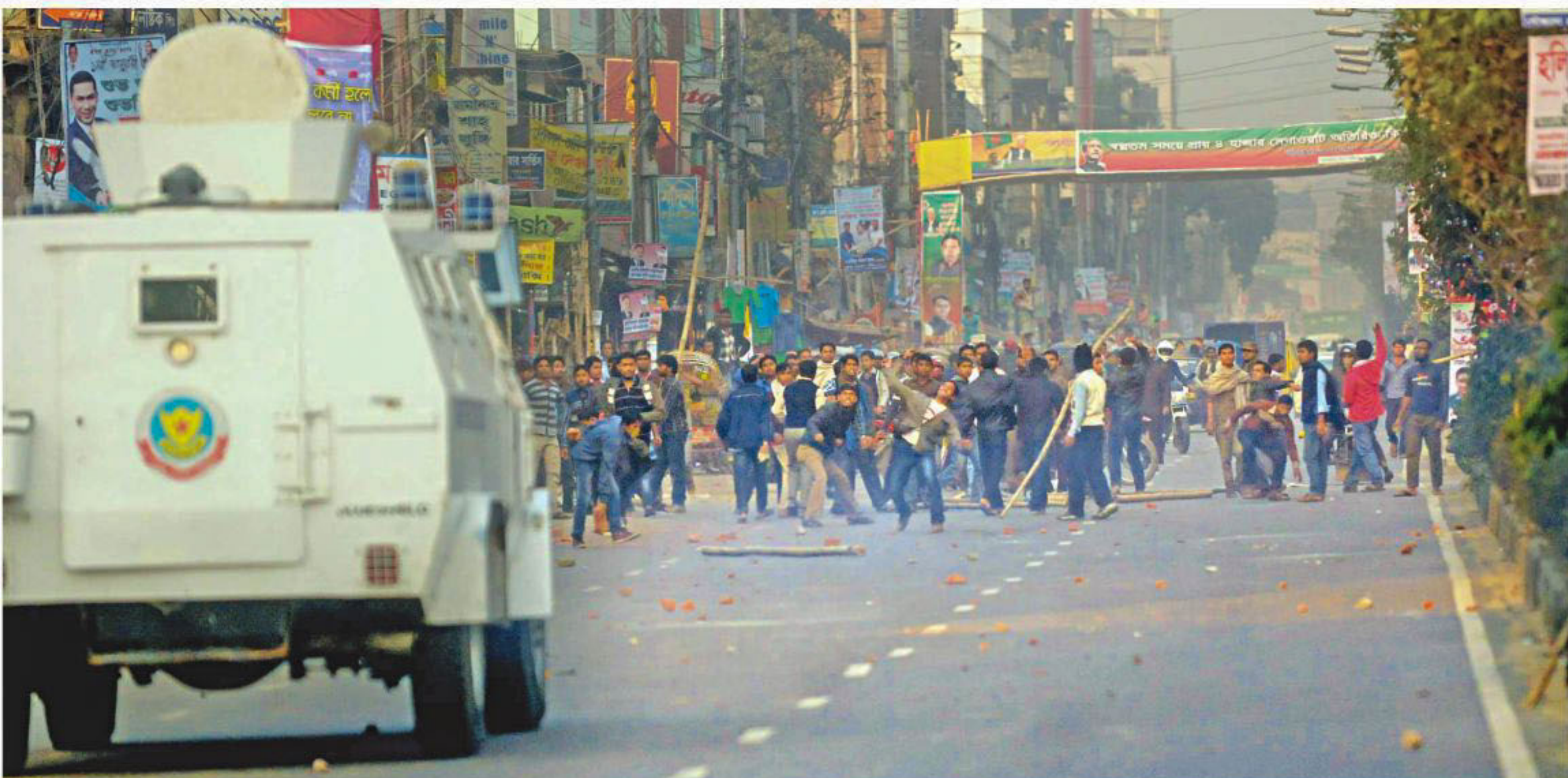
Activists of Jamaat-e-Islami and pro-Jamaat student body Islami Chhatra Shibir hurl brick bats at an armoured vehicle of law enforcers on DIT Road in Malibagh yesterday as they brought out a procession demanding release of their top leaders being tried on war crimes charges.

REJAUL KARIM BYRON The government is going to construct a 13.32-kilometre elevated expressway linking the capital's Shantinagar and Dhaka-Mawa road under public-private partnership (PPP) initiative. Of the total route, 6.43 km will have four lanes while the rest will have a two-lane road. The expressway will be connected to the Mouchak-Moghbaraz flyover. Housing and public works ministry has already sent a project proposal on the expressway's construction work to the cabinet committee on economic affairs. The proposal involving Tk 2,670 crore is likely to be placed in the cabinet committee meeting next week for approval, said an official of the ministry. The expressway will go over the existing roads at SEE PAGE 19 COL 4